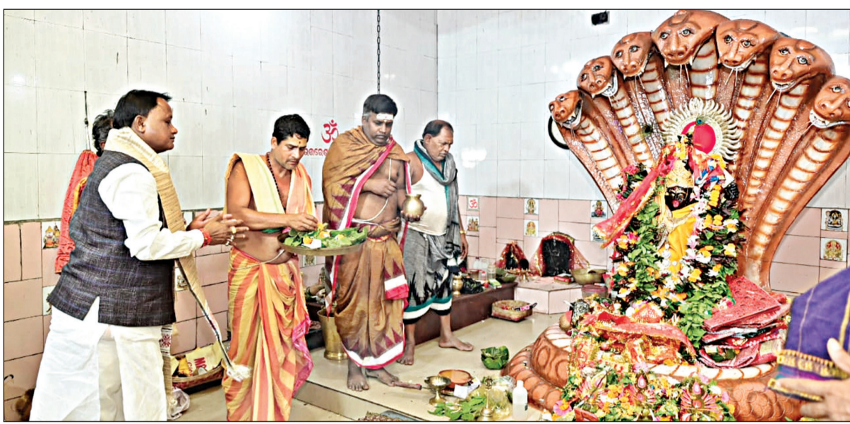
ମୁଖ୍ୟମନ୍ତ୍ରୀ ମୋହନ ଚରଣ ମାଝୀ କେନ୍ଦୁଝରଠାରେ ମା' କାଳୀଙ୍କ ପ୍ରତିମା ପୂଜା ପାଉଥିବା ବିଭିନ୍ନ ମଣ୍ଡପ ଓ ମନ୍ଦିର ଦର୍ଶନ କରି ମା'ଙ୍କ ନିକଟରେ ସମସ୍ତଙ୍କ କଲ୍ୟାଣ ନିମନ୍ତେ ପ୍ରାର୍ଥନା କରିବା ସହ ପୂଜା କମିଟିର ସଦସ୍ୟମାନଙ୍କ ସହ ଆଲୋଚନା କରୁଛନ୍ତି।

ଯାଜପୁର, ୨୧।୧୦(ସଂଚାର ବ୍ୟୁରୋ): କାଳୀ ପୂଜାକୁ ଯାଜପୁର ଗଣପତି ଭାବେ ମାନ୍ୟତା ମିଳିଛି। ଏପିପାଇଁ ଯାଜପୁର ସହର ବେଶ ଉତ୍ସବ ମୁଖୀର ହୋଇଉଠିଛି। ସବୁଠି ପୁରୁଣା ଦେବତା ଏବଂ ସୁନ୍ଦର ଆଲୋକମାଳାରେ ଝଲି ରହି ଉଠୁଥିବା ପୂଜା ସହର। ଗତକାଳି ବିଳମ୍ବିତ ରାତିରେ ମା'ଙ୍କ ପୂଜା ଆରମ୍ଭ ହୋଇଛି। ନିଶାଦିରେ ଏହି ପୂଜା ଆରମ୍ଭ ହୋଇ ବର୍ଷପାଠ ଓ ସହସ୍ର ନାମ ଯଜ୍ଞ ଚାଲିଛି । ଯାଜପୁରରେ କେବଳ ୪୨ଟି ପୂଜା ମଣ୍ଡପରେ ମା' କାଳୀ ଓ ଲକ୍ଷ୍ମୀନାରାୟଣ ପୂଜା ପାଉଛନ୍ତି। ଆଗାମୀ ୧୦ ଦିନ ପର୍ଯ୍ୟନ୍ତ ଲାଗି ରହିବ ଗହଳି। ପୂଜାକୁ ଶାନ୍ତିଶୃଙ୍ଖଳାରେ ଶେଷ କରିବାକୁ ଆୟୋଜକ ମାନଙ୍କ ମଧ୍ୟରେ ବିଶେଷ ପ୍ରସ୍ତୁତି କରାଯାଇଛି। ଯାଜପୁର ସହରର କିଆନାଳୀ ଛକ, ହରପାର୍ବତି ଛକ, ବଡ଼ବଜାର, ଗରିଆପୁର, ନାରାୟଣୀ ଛକ, ହାବେଳି ବଜାର, ଅମ୍ବିକାଳ, ମେଡିକାଲ ଆଦି ଛକରେ ବଡ଼ ଧୁମ୍‌ଧାମ୍‌ରେ ଏହି କାଳୀପୂଜା ପାଳନ ହେଉଛି। ଆଗାମୀ ୧୦ ଦିନ ପର୍ଯ୍ୟନ୍ତ ପ୍ରତ୍ୟେକ ପୂଜା କମିଟି ପକ୍ଷରୁ ବିଭିନ୍ନ ସାଂସ୍କୃତିକ କାର୍ଯ୍ୟକ୍ରମ ଅନୁଷ୍ଠିତ ହେବ। କଳିତ ବର୍ଷ ସହରରେ ତିଜେ ବାଜିବା ଏବଂ ମଦ ଭାରବାର ଉପରେ ସଂପୂର୍ଣ୍ଣ ରୋକ ଲଗାଯାଇଛି। ସଂଧ୍ୟା ସମୟରେ ଭିତରୁ ଦୁଷ୍ଟିରେ ବଣି ସହରରକୁ ଭାରାଯାନ ଏବଂ ୪ ଚଳିଆ ଯାନ ପ୍ରବେଶ ଉପରେ କଟକଣା ଲାଗି କରାଯାଇଛି।