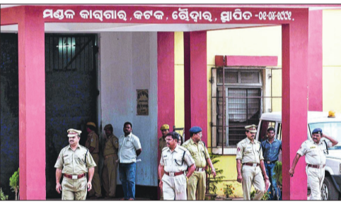
ଆୟୋଜନ କରାଯିବା ସୁରକ୍ଷିତ ଥିଲା କି? ଏ ନିଷ୍ପତ୍ତି ଓ ପୂଜା ଆୟୋଜନର ଦାୟିତ୍ୱ କିଏ ନାହାନ୍ତି ଦେଇଥିଲା, ତାର ମଧ୍ୟ ତଦ୍ୱ ହେବା ଆବଶ୍ୟକ। ପୂଜା ପାଇଁ ଜେଲ ଭିତରକୁ ଚେଷ୍ଟା ସାମଗ୍ରୀ ଓ ଚେଷ୍ଟାହାର ସ୍ତର, ପୂଜା ସାମଗ୍ରୀ ସହ ପୂଜକ ଓ ୯ ପୃଷ୍ଠା-୬

ଭୁବନେଶ୍ୱର, ୨୧ ଅକ୍ଟୋବର (ସଂଚାର ବ୍ୟୁରୋ): ଚୌକ୍ରୀର ଜେଲକୁ ଦୁଇ ଜଣ ଦିହାରୀ କ'ଣ ଫେରାର ହେବା ଘଟଣାକୁ ନେଇ ଜେଲ ସୁରକ୍ଷା ବ୍ୟବସ୍ଥା ଉପରେ ବିଚାର ପ୍ରଶ୍ନବାଦୀ ସୃଷ୍ଟି କରିଛି। ଏଯାଏଁ ଦୁଇ କ'ଣଦଳ ଚେର ପାଉନି ପୁଲିସ୍। ଏଭଳି ଏକ ସ୍ପର୍ଶକାତର ଘଟଣାରେ 'ସଂଚାର' ହାତରେ ଲାଗିଛି କିଛି ରୋଚକ ତଥ୍ୟ। ଚୌକ୍ରୀର ଜେଲ ଭଳି ସ୍ଥାନ ସିକ୍ୟୁରିଟି ଜେଲକୁ କ'ଣଦା ଫେରାର ହେବା କିଛି ଛୋଟ କଥା ନୁହେଁ। ଏବେ ଖୋଲତାଡ଼ୁ ଅନେକ କଥା ସାମ୍ନାକୁ ଆସୁଛି। ସେ କିତରୁ ଏକ ଗୁରୁତ୍ୱପୂର୍ଣ୍ଣ କଥା ହେଉଛି, ଦୁର୍ଗାପୂଜା ବାଲିଥିବା ସମୟରେ ଉକ୍ତ ଦୁଇ କ'ଣଦା ଚଳିବ ମାରିଛନ୍ତି। ଏବେ ପ୍ରଶ୍ନ ଉଠୁଛି, ଜେଲରେ ଦଶହରା ପୂଜା ପାଇଁ କିଏ ଦେଇଥିଲା ଅନୁମତି। ମିଳିଥିବା ସୂଚନାମୁତାୟୀ, ଯେଉଁ ସମୟରେ କ'ଣଦାଦ୍ୱୟ ଫେରାର ହେଲେ, ସେତେବେଳେ ଚୌକ୍ରୀର ଜେଲରେ ଦୁର୍ଗାପୂଜା ବାଲିଥିଲା। ଜେଲ ଭଳି ଏକ ସମ୍ବେଦନଶୀଳ ସ୍ଥାନରେ ଦୁର୍ଗାପୂଜା