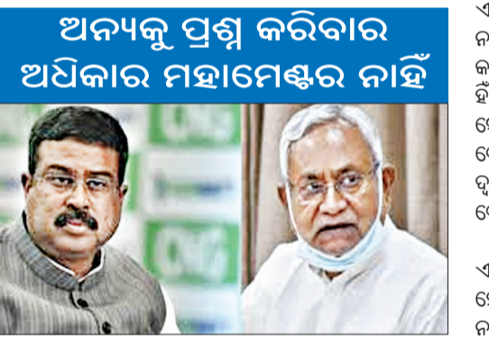
ଅଧିକାର ମହାମେଣ୍ଟର ନାହିଁ

ପାଟଣା, ୮।୧୧: ଆସନ୍ତା ୧୧ ତାରିଖରେ ବିହାର ବିଧାନ ସଭା ନିର୍ବାଚନ ଦ୍ୱିତୀୟ ଚର୍ଚ୍ଚା ଅଧିବେଶନରେ ଲୋକ ସଭାରେ ସଭାପତି ଆସନ୍ତା ୧୪ ତାରିଖରେ ଫଳାଫଳ ଘୋଷଣା ହେବ। ତେବେ ଦ୍ୱିତୀୟ ପର୍ଯ୍ୟାୟ ଭୋଟ୍ ପାଇଁ ଏବେ ପ୍ରଚାର ବେଶ୍ ଜୋରସାରେ ଚାଲିଥିବା ବେଳେ ଏହି ଅବସରରେ ଏନ୍ତ-ଏର ମୁଖ୍ୟମନ୍ତ୍ରୀ ନାମ ଘୋଷଣା କରିବେ ବୋଲି ଅନେକ ଆଶା କରାଯାଉଛି।