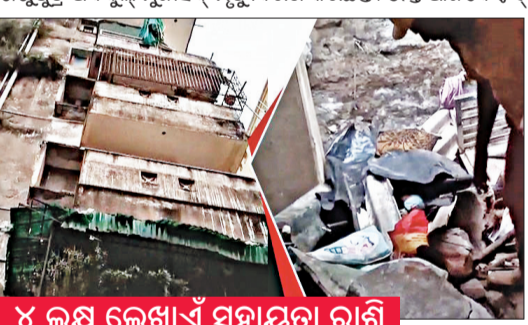
୪ ଲକ୍ଷ ଲେଖାଏଁ ସହାୟତା ରାଶି ଘୋଷଣା କଲେ ମୁଖ୍ୟମନ୍ତ୍ରୀ

ପରିବାରର ୩ ମତ, ୨ ଗୁରୁତର ଜଣକ, ୮।୧୧ (ସଂଚାର ବ୍ୟୁରୋ): କଟକରେ ଘଟିଥିବା ଏକ ଦୁର୍ଘଟଣାର ଅପରାଧୀ ବନ୍ଧୁ ବନ୍ଦୀ ଅଞ୍ଚଳରେ ମଣି ସାଧୁ ଛକ ନିକଟସ୍ଥ ହାଡ଼ିବନ୍ଧୁ ସ୍କୁଲ ନିକଟରେ ଥିବା ଏକ ପୁରୁଣା ଆପାର୍ଟମେଣ୍ଟ ବାଲକୋନି ଭୁଞ୍ଜିତ ପଡ଼ିବା ଫଳରେ ଗୋଟିଏ ପରିବାରର ୩ ଜଣ ମୃତ୍ୟୁବରଣ କରିଛନ୍ତି।