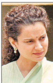
ସହ ଯୋଗାଯୋଗ ଏବଂ ଆଇଟି ସମେତ ପ୍ରମୁଖ ସମିତିର ଅଧ୍ୟକ୍ଷତା କରିବେ। ଏହି ସମିତିରେ ଅଭିନେତ୍ରୀ ତଥା ମନ୍ତ୍ରୀ ସଂସଦ କର୍ଜନା ରାଣାଡ଼ିତ ସାମିଲ ଅଛନ୍ତି। ଶୁଣି