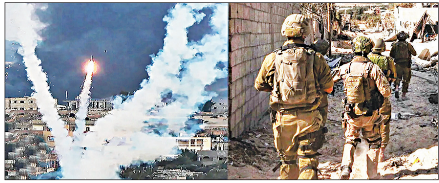
ବିରୁଟ, ୨୭ତମ: ପାଲେଶ୍ୱାଳନ ସମର୍ଥନ ହମାସ ଓ ଇସ୍ରାଏଲ ଯୁଦ୍ଧ ଧୀରେ ମଧ୍ୟପ୍ରାନ୍ତକୁ ଅଣାଇ କରାଯାଇଛି। ଏହି ବିବାଦ ଏବେ ଇସ୍ରାଏଲ ଏବଂ

ଲେବାନନ ମଧ୍ୟରେ ଘନାଭୂତ ହୋଇଛି। ହମାସର ଶକ୍ତିକୁ ଦୂର୍ବଳ କରିବା ପରେ ଏବେ ଇସ୍ରାଏଲର ଚାଟିଂଗରେ ରହିଛି ଲେବାନନର ସମର୍ଥନ ହେଉଥିବା।