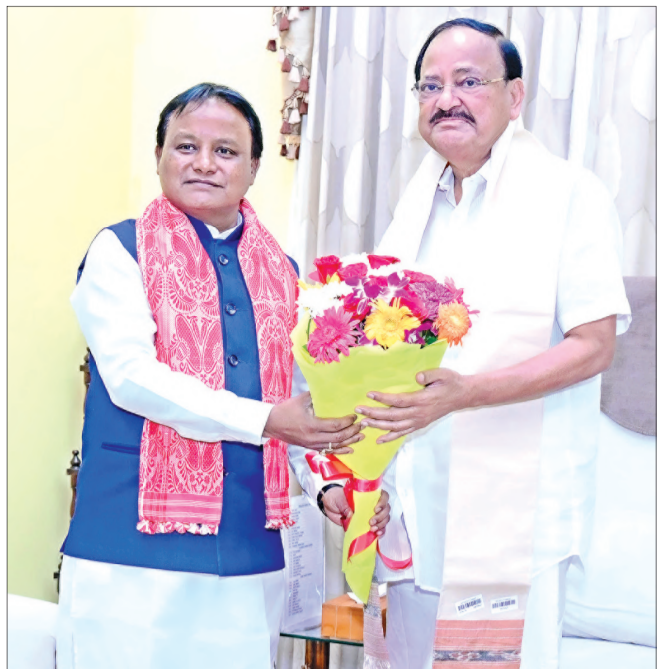
ରାଜ ଭବନରେ ପୂର୍ବତନ ଉପରାଷ୍ଟ୍ରପତି ଏମ ଭେଙ୍କୟା ନାଇଡୁଙ୍କୁ ସହ ମୁଖ୍ୟମନ୍ତ୍ରୀ ମୋହନ ବରଣ ମାଝୀ