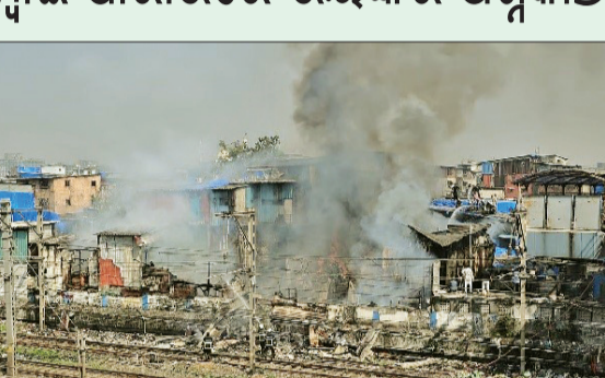
ମୁମ୍ବାଇ, ୨୨।୧୧: ଶନିବାର ଅପରାହ୍ଣରେ ମୁମ୍ବାଇର ଧାରାଭି ଅଞ୍ଚଳରେ ଏକ ଭୟଙ୍କର ଅଗ୍ନିକାଣ୍ଡ ଘଟିଛି। ଯାହା ବ୍ୟାପକ ଆତଙ୍କ ସୃଷ୍ଟି କରିଛି।