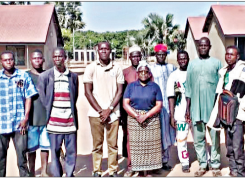
ଅପହରଣକାରୀମାନେ କହିଛନ୍ତି ଯେ, କିଛି ପିଲା ଖସି ପଳାଇ ଯାଇଥିଲେ କିନ୍ତୁ ଅନେକ ୭ ବର୍ଷ ବୟସର ଛୋଟ ପିଲାଙ୍କୁ ନିକଟତର ରଖି ନିଆଯାଇଥିଲା।

ଅଭୁକ୍ତା, ୨୨।୧୧: ନାଇଜେରିଆର ନାଇଜେରିଆର ପାପିରିରେ ଥିବା ସେଣ୍ଟ ମେରି କ୍ୟାଥୋଲିକ ବୋର୍ଡିଂ ସ୍କୁଲରେ ପଶି ଛାତ୍ର ଏବଂ ଶିକ୍ଷକଙ୍କୁ ଅପହରଣ କରିବାକୁ ଚେଷ୍ଟା କରାଯାଇଥିଲା।