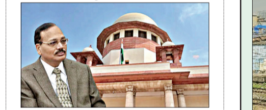
ନୂଆଦିଲ୍ଲୀ, ୨୨।୧୧: ଜଷ୍ଟିସ୍ ସୂର୍ଯ୍ୟକାନ୍ତ ଭାରତର ନୂଆ ସିଜେଆଇ ଭାବରେ ଯୋଗଦାନ କରିଛନ୍ତି। ଭାରତର ୫୩ ତମ ଚିଫ୍ ଜଷ୍ଟିସ୍ ଅଫ୍ ଇଣ୍ଡିଆ (ସିଜେଆଇ) ଭାବରେ ଜଷ୍ଟିସ୍ ସୂର୍ଯ୍ୟକାନ୍ତ ନିଜର କାର୍ଯ୍ୟକାଳ ଆରମ୍ଭ କରିବେ।