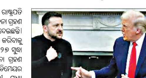
ସେ ଏକ ଦୃଢ଼ରେ ପସିଧିତ, କିନ୍ତୁ ଆମେରିକା ରାଷ୍ଟ୍ରପତି ଟ୍ରମ୍ପ୍ ଶାନ୍ତି ଯୋଜନା ଯୁକ୍ରେନୀୟ ଲୋକଙ୍କ ସ୍ୱାର୍ଥରେ ନୁହେଁ।

କିଭ୍/ଝାଟ୍ଟି, ୨୨।୧୧: ଆମେରିକା ରାଷ୍ଟ୍ରପତି ତ୍ରମ୍ପଙ୍କୁ ଟ୍ରମ୍ପ୍ ଯୁକ୍ରେନକୁ ଏକ ଶାନ୍ତି ଯୋଜନା ଗ୍ରହଣ କରିବା ପାଇଁ ଦୃଢ଼ ଦିନର ଅଲଟିମେଟମ ଦେଇଛନ୍ତି।