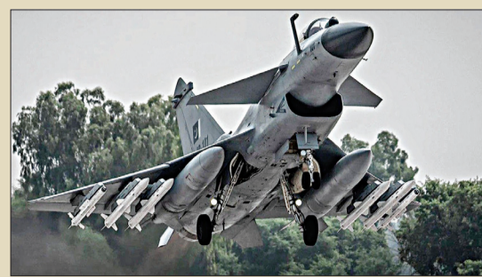
ଏହାର ଅସ୍ତ୍ରଶସ୍ତ୍ର ଶକ୍ତି ଏବଂ ପ୍ରଦାନ କରିବା ପାଇଁ ଏହି ସଂଘର୍ଷର ସୁଯୋଗ ନେଇଥିଲା।