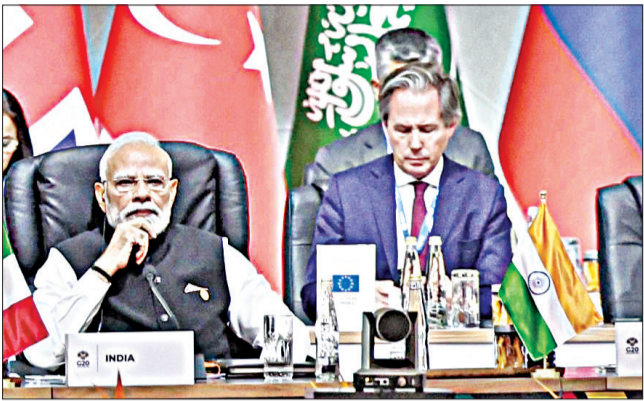
ଜି-୨୦ ଶିଖର ସମ୍ମିଳନୀ