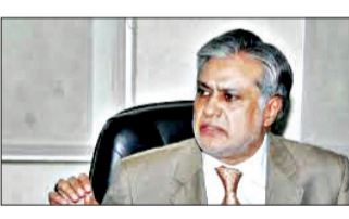
କରିଛନ୍ତି। ସିନ୍ଧୁ ଜଳ ସହି ବ୍ୟତୀତ ପାକିସ୍ତାନ ପୁଣି ଥରେ କାଶ୍ମୀରକୁ ନେଇ ବିବାଦ କରିଛି।

ନୂଆଦିଲ୍ଲୀ, ୨୨।୧୧: ପାକିସ୍ତାନର ବିଦେଶ ମନ୍ତ୍ରୀ ଇଶାକ ଡାର୍ ପୁଣି ଥରେ ଅନ୍ତର୍ଜାତୀୟ ମଞ୍ଚରେ ସିନ୍ଧୁ ଜଳରୁକ୍ତି କଥା ଉଠାଇଛନ୍ତି। ସେ ଯୁରୋପୀୟ ମଞ୍ଚରେ କୋର ଦେଇ କହିଛନ୍ତି ଯେ, ସିନ୍ଧୁ ଜଳ ସହି ସ୍ଥିତି ହେବା ଅଞ୍ଚଳର ସ୍ଥିରତା ପାଇଁ ପ୍ରକୃତ ସମାଧାନ ଅଟେ।