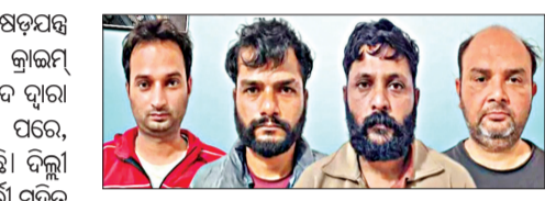
ଅଗୋଷ୍ଟରେ ପିପ୍ଲ ଏବଂ ୯୨ଟି କାର୍ତ୍ତବ୍ୟ ଗୁଳି କବଚ କରିଛି। ଏହି ପିପ୍ଲଗୁଡ଼ିକ ହେଉଛି ଦୁର୍ଲଭ ନିର୍ମିତ ପି-୧୫ - ୫.୭ ଏବଂ ଚୀନ ନିର୍ମିତ ପି-୧୫-୩, ଯାହା ସାଧାରଣତଃ ସ୍ୱତନ୍ତ୍ର ବାହିକା ଏବଂ ସୁରକ୍ଷା ସଂଗ୍ରହଣ ଦ୍ୱାରା ବ୍ୟବହୃତ ହୁଏ।

ନୂଆଦିଲ୍ଲୀ, ୨୨।୧୧: ପୁଣି ଏକ ବଡ଼ ସତ୍ୟକୁ କରୁଥିଲେ ଆତଙ୍କବାଦୀ ପର୍ଯ୍ୟଟକ କଲା କ୍ରାଇମ୍ ଟ୍ରାଷ୍ଟ। ଦିଲ୍ଲୀର ଲାଲକିଲ୍ଲାରେ ମେୱେ-ଏ-ମହମ୍ମଦ ଦ୍ୱାରା କରାଯାଇଥିବା ବିଶ୍ୱାସନୀୟତା ପୂର୍ବକ ୧୦୦ଟି ପରେ, ରାଜଧାନୀରେ ଆଉ ସତ୍ୟକୁ ସାମ୍ନାକୁ ଆସିଛି।