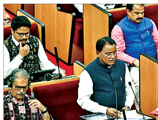
ଭୁବନେଶ୍ୱର, ୨୮ ଫେବୃଆରୀ (ସଂଚାର ବ୍ୟୁରୋ): ମୁଖ୍ୟମନ୍ତ୍ରୀ ମୋହନ ଚରଣ ମାଣିଆ ଆଜି ଗୃହରେ ୨୦୨୫-୨୬ ଆର୍ଥିକ ବର୍ଷ ପାଇଁ ୧୭,୪୪୦ କୋଟି ବଜେଟ୍ ଆଗତ କରିଛନ୍ତି। ଏଥିରେ କାର୍ଯ୍ୟକ୍ରମ ବ୍ୟୟ

ବାବଦରେ ସର୍ବାଧିକ ୧୩,୭୧୭ ଟଙ୍କାର ବ୍ୟୟବରାଦ ଥିବାବେଳେ ପ୍ରଶାସନିକ ବ୍ୟୟ ପାଇଁ ୩୩୮୯ କୋଟି, ବିପର୍ଯ୍ୟୟ ପ୍ରଶାସନ ପାଇଁ ୧୭୧ କୋଟି ଓ ରାଜ୍ୟ ବଜେଟ୍ରେ ସ୍ଥାନାନ୍ତର ବାବଦରେ ୧୬୬୪ କୋଟି ଟଙ୍କା ରହିଥିଲା। ୨୦୨୫-୨୬ ବର୍ଷରେ ମୂଳ ବଜେଟ୍ ୨ ଲକ୍ଷ ୯୦ ହଜାର କୋଟି ଟଙ୍କା ରହିଥିଲା। ଅତିରିକ୍ତ ବଜେଟ୍ ଆଗତ ପରେ ରାଜ୍ୟର ମୋଟ ବଜେଟ୍ ପରିମାଣ ୩୧ ଲକ୍ଷ ୭୬ ହଜାର କୋଟି ଅଟେ।