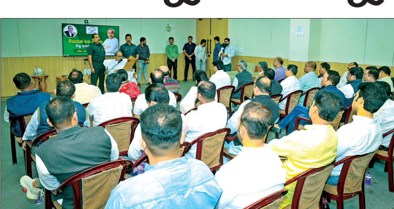
କାରଣରୁ ପଛପୁଅ ଦେଉଛି। ନିକଟରେ ବିଜେଡିର ରାଜନୈତିକ ପରାମର୍ଶଦାତା ବୈଠକ ବସିଥିଲା। ବିଶ୍ୱ ସ୍ୱତ୍ୱରୁ ମିଳିଥିବା ସୂଚନା ଅନୁଯାୟୀ, ଦଳଠାରୁ ଲୋକେ ଦୂରେଇଯାଉଥିବା ନେଇ ବୈଠକରେ ଉଦ୍‌ବେଗ ପ୍ରକାଶ ପାଇବା ସହ ଯୁକ୍ତକାଳୀନ ଭିତରେ ଏହାର

ଭୁବନେଶ୍ୱର, ୨୮ ଫେବୃଆରୀ (ସଂଚାର ବ୍ୟୁରୋ): ନୂଆପଡ଼ା ଉପନିର୍ବାଚନରେ ଦଳ ଚିଡି ନମ୍ବର ସ୍ଥାନରେ ରହିବା ପରେ ଲୋକେ ଦଳଠାରୁ ଦୂରେଇବା ଲକ୍ଷ୍ୟ କରି ଏବେ ଲୋକଙ୍କ ନିକଟକୁ ଯିବାକୁ ନେତାମାନଙ୍କ ପାଇଁ ଫଡ଼଼ା ଜାରି କରିଛନ୍ତି ବିଜେଡି। ଗାଁଗହଳରେ ଲୋକସଭା କାର୍ଯ୍ୟକ୍ରମର ଖବର ପାଇଲା ମାତ୍ରେ ସେଠାରେ ପହଞ୍ଚିବା ସହ ଆର୍ଥିକ ସହାୟତା ଯୋଗାଇଦେବାକୁ ଚାରିବି କରାଯାଇଛି। ତେବେ ଦଳର ଏଭଳି ନିର୍ଦ୍ଦେଶ ମାନିବାକୁ କିନ୍ତୁ ନେତାମାନେ କୁହୁ କୁହୁ ହେଉଛନ୍ତି। କିଏ ଲୋକଙ୍କ ମୁତ୍ ଦେଖି ଚାହୁଁଛନ୍ତି ତ ଆଉ କିଏ ଖର୍ଚ୍ଚ