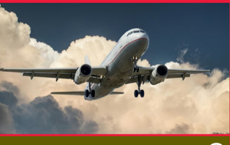
କେନ୍ଦ୍ର ସରକାର ଦେଲେ ମଞ୍ଜୁରି

ନୂଆଦିଲ୍ଲୀ, ୨୫ ଡିସେମ୍ବର: ଦେଶବାସୀଙ୍କୁ ନୂଆ ବର୍ଷରେ ତିନିଟି ନୂଆ ଏୟାରଲାଇନ୍ସ୍ ମିଳିପାରେ। କେନ୍ଦ୍ର ସରକାର ଦେଶରେ ତିନୋଟି ନୂତନ ବିମାନ ସେବାକୁ ଅନୁମୋଦନ କରିଛନ୍ତି। ସେବାମରିକ ବିମାନ ଚଳାଚଳ ମନ୍ତ୍ରାଳୟ ତିନୋଟି ପ୍ରସ୍ତାବିତ ବିମାନ ସେବାକୁ ଏନପିଏ ପ୍ରଦାନ କରିଛି। ଏଣିକି ଇଣ୍ଡିଗୋ, ଏୟାର ଇଣ୍ଡିଆ ଏବଂ ସାଇସଜେଟ୍ ଭଳି ବିମାନ ସେବା ବ୍ୟତୀତ, ଲକ୍ଷ ଲକ୍ଷ ବିମାନ ଯାତ୍ରୀଙ୍କ ପାଖରେ ତିନୋଟି ନୂତନ ବିକଳ୍ପ ରହିବ। ଏହି ନୂଆ ଏୟାରଲାଇନ୍ସ୍ ଆରମ୍ଭ ହେବା ପରେ ବିମାନ ସେବାର ସ୍ୱେଚ୍ଛାଚାରିତାକୁ ବନ୍ଦ ହୋଇପାରିବ। ଏହି ତିନି ବିମାନ ସେବା ଆରମ୍ଭ ହେବା ପରେ ସେବା କ୍ଷେତ୍ରରେ ପ୍ରତିଯୋଗିତା ବୃଦ୍ଧି ପାଇବ ଏବଂ ସାଧାରଣ ଲୋକମାନେ ଏଥିରୁ ଲାଭ ପାଇବେ। କେନ୍ଦ୍ର ସେବାମରିକ ବିମାନ ଚଳାଚଳ ମନ୍ତ୍ରା ରାମ ମୋହନ ନାୟକ୍ ଏକ୍ସପ୍ରେସ୍‌ରେ କହିଛନ୍ତି, ଗତ ସପ୍ତାହରେ ତିନୋଟି ନୂଆ ଏୟାରଲାଇନ୍ସ୍ ଚିନ୍ତା ସହିତ ସାକ୍ଷାତ କରିଥିଲେ। ସେ ଯୋଗୁରେ ଲେଖିଛନ୍ତି, "ଗତ ସପ୍ତାହ ମଧ୍ୟରେ, ଭାରତୀୟ ଆକାଶରେ ଉଡ଼ିବାକୁ ଆକାଶୀ ରଖିଥିବା ନୂଆ ଏୟାରଲାଇନ୍ସ୍ ଶଙ୍ଖ ଏୟାର, ଅଲ୍ ହିନ୍ଦ୍ ଏୟାର ଏବଂ ଫ୍ଲାଇ ଏକ୍ସପ୍ରେସ୍ ଚିନ୍ତା ସହିତ ସାକ୍ଷାତ କରି ଶୁଣି ଅନୁଭବ ହୋଇଛି। ଶଙ୍ଖ ଏୟାର ପୂର୍ବରୁ ମନ୍ତ୍ରାଳୟରୁ ଏନପିଏ ପାଇସାରିଛି। ଅଲ୍ ହିନ୍ଦ୍ ଏୟାର ଏବଂ ଫ୍ଲାଇ ଏକ୍ସପ୍ରେସ୍ ଏହି ସପ୍ତାହରେ ସେବାମରିକ ଏନପିଏ ପାଇଛନ୍ତି।"