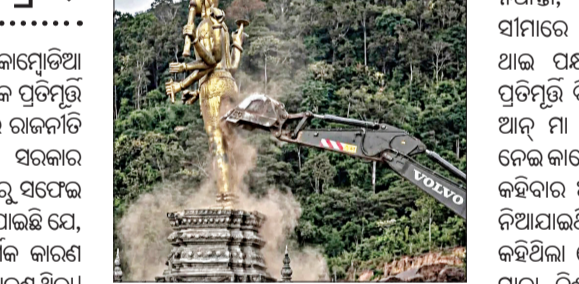
ଧର୍ମକୁ ସମାନ ଭାବରେ ସମ୍ମାନ କରେ। ଆଇ ଅଧିକାରୀମାନେ କହିଛନ୍ତି, ପ୍ରତିମୂର୍ତ୍ତି ପରେ ସ୍ଥାପିତ ହୋଇଥିଲା ଏବଂ ଏହାକୁ ଆନୁଷ୍ଠାନିକ ଭାବରେ ଏକ ଧାର୍ମିକ ସ୍ଥଳ ଭାବରେ ସ୍ୱୀକୃତି

ଭାରତର ତାନ୍ତ୍ର ପ୍ରତିକ୍ରିୟା ବ୍ୟାଙ୍କକ୍, ୨୫।୧୨: ଆଇଲାଣ୍ଡ ଓ କାମ୍ପୋଡିଆ ସୀମାରେ ଥିବା ଭଗବାନ ବିଷ୍ଣୁଙ୍କ ଏକ ପ୍ରତିମୂର୍ତ୍ତି ଭଙ୍ଗାଗଲା ନେଇ ଅନ୍ଧାରରେ ପ୍ରଚାର ହେଉଛି। ଏହି ଘଟଣାକୁ ଭାରତ ସରକାର ନିନ୍ଦା କରିବା ପରେ ଆଇଲାଣ୍ଡ ପକ୍ଷରୁ ସଫେଇ ଦିଆଯାଇଛି। ଆଇଲାଣ୍ଡ ପକ୍ଷରୁ କୁହାଯାଇଛି ଯେ, ମୂର୍ତ୍ତି ଭଙ୍ଗା ପଛରେ କୌଣସି ଧାର୍ମିକ କାରଣ ନଥିଲା ବରଂ ପୁରୁଣା ଓ ପ୍ରଶାସନିକ କାରଣ ଥିଲା। ଆଇ-କାମ୍ପୋଡିଆନ୍ ବର୍ତ୍ତମାନ ପ୍ରେସ୍ ସେକ୍ଟର କହିଛି ଯେ, ହିନ୍ଦୁ ଦେବତାଙ୍କ ପ୍ରତିମୂର୍ତ୍ତି ନଷ୍ଟ ଧର୍ମ କିମ୍ବା ବିଶ୍ୱାସ ସହିତ ଜଡ଼ିତ ନୁହେଁ। ଆଇଲାଣ୍ଡ କହିଛି ଯେ, ଏହା ହିନ୍ଦୁ ଧର୍ମ ସମେତ ସମସ୍ତ