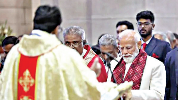
ଦେଶବାସୀଙ୍କୁ ଜଣାଇଲେ ବଡ଼ଦିନର ଶୁଭେଚ୍ଛା

ନୂଆଦିଲ୍ଲୀ, ୨୫।୧୨: ପ୍ରଧାନମନ୍ତ୍ରୀ ନରେନ୍ଦ୍ର ମୋଦି ଗୁରୁବାର ବଡ଼ଦିନ ଅବସରରେ ଦିଲ୍ଲୀର ସିଟିହାଲିକ୍ କ୍ୟାଥେଡ୍ରାଲ୍ ଚର୍ଚ୍ଚ ଅଫ୍ ଦି ରିଟେର୍ନିସନର ସକାଳ ପ୍ରାର୍ଥନାରେ ଅଂଶଗ୍ରହଣ କରିଛନ୍ତି। ଏହି ସଭାରେ ଦିଲ୍ଲୀ ଓ ଉତ୍ତର ଭାରତର ଖ୍ରୀଷ୍ଟିୟ ସମୁଦାୟର ଲୋକେ ବହୁ ସଂଖ୍ୟାରେ ଯୋଗ ଦେଇଥିଲେ। ସଭାରେ ପ୍ରାର୍ଥନା, କ୍ରିସ୍ମାସ କାର୍ଯ୍ୟକ୍ରମ ଆଦି ଗାନ କରାଯାଇଥିବା ବେଳେ ଦିଲ୍ଲୀ ବିଶ୍ୱପୀ ରାଜକ୍ଷେତ୍ରରେ ଚର୍ଚ୍ଚ ଚାଲି ଯାଇଛି।