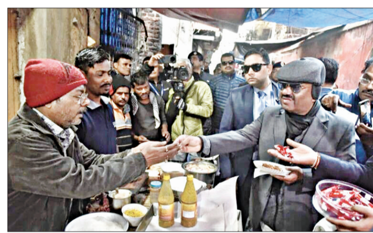
ନାହିଁ ମେଲ୍ ଆସିବାକୁ ଦିଆଗୁରୁବାରର ଇଡି ତଦନୁ ନେଇ ରାଜ୍ୟ ରାଜନୀତି ସରକାରମ୍ଭ ହୋଇଛି ଏହି ପରିପ୍ରେକ୍ଷାରେ ରାଜ୍ୟପାଳ କହିଛନ୍ତି, "ମୁଁ ଗୁରୁବାରର ପ୍ରକଳ୍ପରେ ଯିବାକୁ ଚାହୁଁନାହିଁ। ମାମଲାଟି ବର୍ତ୍ତମାନ ବିଚାରାଧୀନ ରହିଛି।"

କୋଲକାତା, ୯।୧(ସଂଚାର ବ୍ୟୁରୋ): ଗୁରୁବାର, ରାଜ୍ୟପାଳ ଧନକପୁର୍ଣ୍ଣ ମେଳାକୁ ଅଣଦେଖା କରି, ରାଜ୍ୟପାଳ ଶୁଭକାରୀ କୋଲକାତାରେ ରାସ୍ତାକୁ ଉଦ୍ଘାଟନ କଲେ ଏକ ଶାନ୍ତ ଯୋଜନାରେ ଏକାଧିକ କିମ୍ବଦନ୍ତୀ ଘଟଣା ଘଟିଛି। ଏହା ବ୍ୟତୀତ, ହେୟାର ଷ୍ଟ୍ରିଟ୍ ଆନାର ପୂର୍ଣ୍ଣ ରାଜ୍ୟପାଳଙ୍କୁ ଧନକ ଦେବା ଅଭିଯୋଗରେ ନ୍ୟୁଟାଉନର ଜଣେ ବ୍ୟକ୍ତିଙ୍କୁ ଗିରଫ କରିଛି। ସେ ଗୁରୁବାର ଯୋଗ୍ୟ ଶୁଣାଣିରେ ଧନକପୁର୍ଣ୍ଣ ଇ-ମେଲ୍ ସହେ ସେ ଧନକ ମିଳିଥିଲା ଧନକପୁର୍ଣ୍ଣ ଇ-ମେଲ୍କୁ ଅଣଦେଖା କରି, ରାଜ୍ୟପାଳ ଶୁଭକାରୀ କୋଲକାତାରେ ରାସ୍ତାକୁ ଉଦ୍ଘାଟନ କଲେ ଏକ ଶାନ୍ତ ଯୋଜନାରେ ଏକାଧିକ କିମ୍ବଦନ୍ତୀ ଘଟଣା ଘଟିଛି। ଏହା ବ୍ୟତୀତ, ହେୟାର ଷ୍ଟ୍ରିଟ୍ ଆନାର ପୂର୍ଣ୍ଣ ରାଜ୍ୟପାଳଙ୍କୁ ଧନକ ଦେବା ଅଭିଯୋଗରେ ନ୍ୟୁଟାଉନର ଜଣେ ବ୍ୟକ୍ତିଙ୍କୁ ଗିରଫ କରିଛି। ସେ ଗୁରୁବାର ଯୋଗ୍ୟ ଶୁଣାଣିରେ ଧନକପୁର୍ଣ୍ଣ ଇ-ମେଲ୍ ସହେ ସେ ଧନକ ମିଳିଥିଲା ଧନକପୁର୍ଣ୍ଣ ଇ-ମେଲ୍କୁ ଅଣଦେଖା କରି, ରାଜ୍ୟପାଳ ଶୁଭକାରୀ କୋଲକାତାରେ ରାସ୍ତାକୁ ଉଦ୍ଘାଟନ କଲେ ଏକ ଶାନ୍ତ ଯୋଜନାରେ ଏକାଧିକ କିମ୍ବଦନ୍ତୀ ଘଟଣା ଘଟିଛି। ଏହା ବ୍ୟତୀତ, ହେୟାର ଷ୍ଟ୍ରିଟ୍ ଆନାର ପୂର୍ଣ୍ଣ ରାଜ୍ୟପାଳଙ୍କୁ ଧନକ ଦେବା ଅଭିଯୋଗରେ ନ୍ୟୁଟାଉନର ଜଣେ ବ୍ୟକ୍ତିଙ୍କୁ ଗିରଫ କରିଛି।