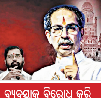
ଲଟେରୀ ବ୍ୟବସ୍ଥାକୁ ବିରୋଧ କରି ଟିଏଠକରୁ ଉଠି ଆସିଲା ଉଦ୍ଧବ ସେନା

ମୁମ୍ବାଇ, ୨୨।୧: ମୁମ୍ବାଇ ମେୟର ପଦବାକୁ ନେଇ ରାଜନୀତିକ ଯୁଦ୍ଧ ଚାଲିଥିବା ବେଳେ ଗୁରୁବାର ନଗରୀୟ ବ୍ୟବସ୍ଥାରେ ସହରର ଭାଗ୍ୟ ନିର୍ଦ୍ଧାରଣ କରାଯାଇଛି।