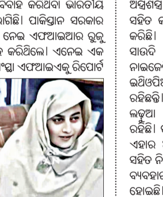
ତୀର୍ଥଯାତ୍ରା ନାଁରେ ପାକିସ୍ତାନ ଯାଇ କରିଥିଲେ ବିବାହ

ଲାହୋର, ୨୨।୧: ଧାର୍ମିକ ଯାତ୍ରା ନାଁରେ ପାକିସ୍ତାନ ଯାଇ ବିବାହ କରିଥିବା ଭାରତୀୟ ମହିଳା ସରକାରୀ ଟ୍ରକ ପାଇଁ ଅରୁଆ ବନ୍ଦିତାରେ ଲାଗିଛି।