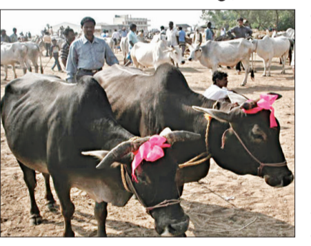
କହିଛନ୍ତି ଯେ, ଏବେ ତାଙ୍କ ପୁଅ ପାଠ ପଢୁଛି। ମାମଲା ହେଲେ କ୍ୟାରିଅର ଖରାପ ହୋଇଯିବ। ତଥାପି ଗୋସେବକମାନେ ଏହାକୁ ଗ୍ରହଣ କରିନାହାନ୍ତି। ଏହା ସାଧାରଣ କଥା ନୁହେଁ ବୋଲି ସେମାନେ କହିଛନ୍ତି। ଗୋରକ୍ଷକ ବାହିନୀର କହିବାନୁସାରେ, ଗାଈକୁ ହିନ୍ଦୁ ଧର୍ମରେ ମାଆ

ଭୋପାଳ, ୨୦୧୯: ଗାଈକୁ ଧରି ଇସଲାମ୍ ଗୋପି ପିନ୍ଧାଇ ଅଭୁଆରେ ଦୁଇ ନାବାଳକ। ଏପରି ଘଟଣା ସାମ୍ବାଲ୍ ଆସିଛି ମଧ୍ୟପ୍ରଦେଶର ଗୁନା ଅଞ୍ଚଳରୁ। ଏଠାରେ କିଛି ନାବାଳକ ଏକ ଗାଈକୁ ମୁସଲିମ୍ ସମ୍ପ୍ରଦାୟର ଧାର୍ମିକ ଗୋପି ପିନ୍ଧାଇଛନ୍ତି। ଏପରିକି ଏସବୁରୁ ଭିତ୍ତି ମଧ୍ୟ ଭାଇରାଲ କରିଛନ୍ତି। ଯାହାକୁ ନେଇ ଉତ୍ତରଜନା ପ୍ରକାଶ ପାଇଛି।