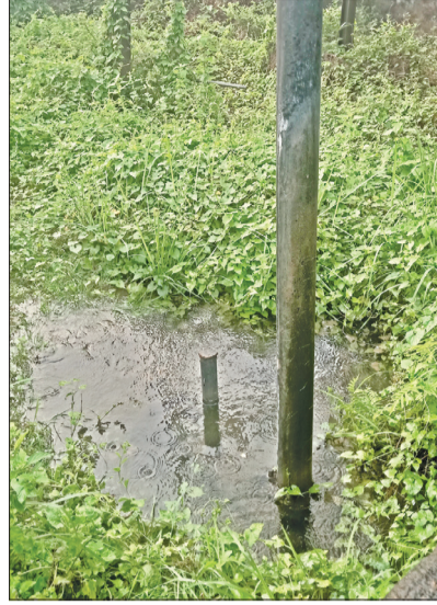
ମାହାଙ୍ଗା, ୯।୩ (ସଂଚାର ବ୍ୟୁରୋ): ମାହାଙ୍ଗା ବ୍ଲକ କଳେଶ୍ୱରପୁର ସଦର ମହକୁମା ଗୋବରା ନଦୀ ନିକଟରେ ଥିବା ଶ୍ରୀକୃଷ୍ଣପୁର-୧ ପାନୀୟ ଜଳ