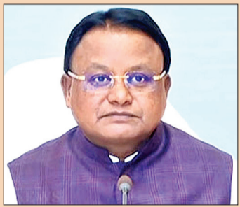
ପରିସ୍ଥିତି ଉପରେ ନିଜର ରାଜିବାକୁ ମୁଖ୍ୟ ସଚିବଙ୍କୁ ନିର୍ଦ୍ଦେଶ

ଭୁବନେଶ୍ୱର, ୧୧ମାର୍ଚ୍ଚ (ସଂଚାର ବ୍ୟୁରୋ): ମଧ୍ୟପ୍ରାନ୍ତରେ ସମ୍ପ୍ରତି ଚାଲିଥିବା ଯୁଦ୍ଧ ପରିସ୍ଥିତି ଯୋଗୁଁ ସେଠାରେ ଅନେକ ଓଡ଼ିଆ ଲୋକ ଅଚଳି ରହିଥିବା ଘଟଣାରେ ମୁଖ୍ୟମନ୍ତ୍ରୀ ମୋହନ ଚରଣ ମାଝୀ ଗଭୀର ଉଦ୍‌ବେଗ ପ୍ରକାଶ କରିଛନ୍ତି। ଓଡ଼ିଆ ଲୋକମାନଙ୍କୁ ସେଠାରୁ ଆଣିବା ଉପରେ ଗୁରୁତ୍ୱ ଆରୋପ କରି ମୁଖ୍ୟମନ୍ତ୍ରୀ ଏହି ଘଟଣା ଉପରେ ନିଜର ରାଜିବାକୁ ଏବଂ ଓଡ଼ିଆ ଲୋକମାନଙ୍କୁ ସେଠାରୁ ଆଣିବା ପାଇଁ ବ୍ୟବସ୍ଥା କରିବାକୁ ମୁଖ୍ୟ ଶାସନ ସଚିବଙ୍କୁ ନିର୍ଦ୍ଦେଶ ଦେଇଛନ୍ତି।