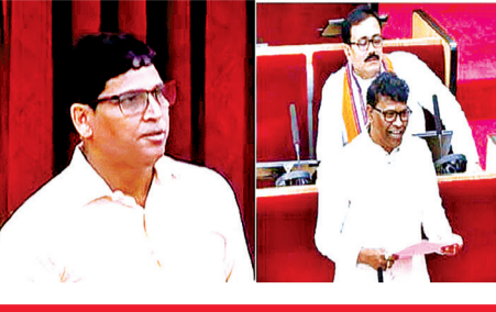
ବିଜେଡି ବିପକ୍ଷତା ପାଇଁ ଦାବନ ଯାଉଛନ୍ତି ଏ ଜିଲ୍ଲାର ଲୋକ

ଭୁବନେଶ୍ୱର, ୧୧।୩ (ସଂଚାର ବ୍ୟୁରୋ) : ମଧ୍ୟପ୍ରାନ୍ତରେ ଚାଲିଥିବା ଯୁଦ୍ଧ ସମୟରେ ଜଣେ ଓଡ଼ିଆ ଯୁଦ୍ଧ କର୍ତ୍ତାବ୍ୟରେ ମୃତ୍ୟୁବରଣ କରିଛନ୍ତି । ସମଗ୍ର ଦେଶ ଓ ବିଶେଷ ଭାବେ ରାଜ୍ୟର ଅନେକ ପରିବାର ଏବେ ଭୟରେ ଅଛନ୍ତି । ସେମାନଙ୍କ ଉଦ୍ଧାର ପାଇଁ ରାଜ୍ୟ ସରକାର କିଛି ଯୋଜନା ପ୍ରସ୍ତୁତ କରୁଛନ୍ତି ନା କେବଳ ଓଡ଼ିଆ ଅସୁରା କଥା କହି ଭାଷଣବାଦି କରୁଛନ୍ତି । ଆଜି 'ଓଡ଼ିଆ ଶ୍ରମିକ ଓ ବୁଦ୍ଧିଜୀବୀମାନେ ବାହାର ରାଜ୍ୟ ଓ ବିଦେଶରେ ହେଉଛନ୍ତି ନିର୍ଯ୍ୟାତ, ଓଡ଼ିଆଙ୍କ ଅସୁରା ଓ ସୁରକ୍ଷା ପାଇଁ ରାଜ୍ୟ ସରକାରଙ୍କ ପଦକ୍ଷେପର ଅଭାବ' ଶୀର୍ଷକ ମୂଳତତ୍ତ୍ୱ ପ୍ରସ୍ତାବ ଆଲୋଚନାରେ ଏଭଳି ବର୍ଷିକ୍ଷିତ ବିଜେଡି ଓ କଂଗ୍ରେସ ବିଧାୟକ ।