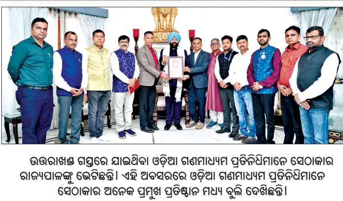
ଉତ୍ତରାଖଣ୍ଡ ଗସ୍ତରେ ଯାଇଥିବା ଓଡ଼ିଆ ଗଣମାଧ୍ୟମ ପ୍ରତିନିଧୀମାନେ ସେଠାକାର ରାଜ୍ୟପାଳଙ୍କୁ ଭେଟିଛନ୍ତି । ଏହି ଅବସରରେ ଓଡ଼ିଆ ଗଣମାଧ୍ୟମ ପ୍ରତିନିଧୀମାନେ ସେଠାକାର ଅନେକ ପ୍ରମୁଖ ପ୍ରତିଷ୍ଠାନ ମଧ୍ୟ ବୁଲି ଦେଖିଛନ୍ତି ।