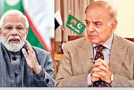
ପ୍ରମୁଖ୍ୟତା ଏବଂ ଭୁଲ୍ଲିତ୍ୱ ପ୍ରଭୃତି ଅର୍ଥନୀତିକୁ ଜନସାଧାରଣଙ୍କ ଦୃଷ୍ଟି ହତ୍ୟାକରା ପାଇଁ ପାକିସ୍ତାନ ସାମା ପାରରେ ଯେଉଁ ରକ୍ତାକ୍ତ ସଂଘର୍ଷ ଆପଣାଇଛି, ଭାରତ ସାରା ବିଶ୍ୱ ସମ୍ପୂର୍ଣ୍ଣରେ ତାହାର ସେହି 'ପୁରୁଣା ପ୍ରବୃତ୍ତି'ର ପର୍ଯ୍ୟାୟ କରିଦେଇଛି। କାବୁଲର ନିଶା ମୂଲି କେନ୍ଦ୍ର ଉପରେ ପାକିସ୍ତାନର ବୋମାମାଡ଼ ପରେ ଭାରତ ଏଥର କେବଳ 'ନିନ୍ଦା' କରି

ନୂଆଦିଲ୍ଲୀ, ୧୮ମ: କୁଟନୀତି ଦୂନିଆରେ ପ୍ରାୟତଃ କଥାଗୁଡ଼ିକ ଅତି ମାପିତ୍ୱ, ଦୂରଦୃଷ୍ଟି ବ୍ୟତୀତ ଏବଂ କୁଟନୀତିକ ଶୈଳୀରେ କୁହାଯାଇଥାଏ। କିନ୍ତୁ ଯେତେବେଳେ ପାଣି ମୁକ୍ତ ଉପରକୁ ଚାଲିଯାଏ, ସେତେବେଳେ ସିଧାସଳଖ ଆକ୍ରମଣାତ୍ମକ ଆଭିମୁଖ୍ୟ ଗ୍ରହଣ କରିବାକୁ ପଡ଼ିଥାଏ। ମାର୍ଚ୍ଚ ୧୬ ରାତିରେ ଆପଗାନିସ୍ତାନର ରାଜଧାନୀ କାବୁଲରେ ପାକିସ୍ତାନ ଯେଉଁ ବର୍ଦ୍ଧରତା ଦେଖାଇଛି, ତାହା ପରେ ଭାରତ ଠିକ୍ ସେଇଆ ହିଁ କରିଛି। ଜଣେ ବନ୍ଧୁ ରାଷ୍ଟ୍ରର ଘରେ ପାକିସ୍ତାନର ଏୟାରସ୍ତ୍ରୀକକୁ ନେଇ ଶୁଦ୍ଧ ଭାରତ ସମ୍ପୂର୍ଣ୍ଣ କରିଦେଇଛି ଯେ, ଏଭଳି ବର୍ଦ୍ଧରତା ସହ୍ୟ କରାଯିବନି। ଅନ୍ତର୍ଜାତୀୟ ସମୁଦାୟ ଏହା ନିଶ୍ଚିତ କରୁ ଯେ ଅପରାଧୀମାନଙ୍କୁ ଯେପରି କଠୋର ଦଣ୍ଡ ମିଳିବ। ଭାରତର ଏହି ସମ୍ପର୍କ ସିଧାସଳଖ ଭାବେ ଇସ୍ରାଏଲିକ ଦୂନିଆ ଅର୍ଥାତ୍ ଓଆଇସିକୁ ଆଇଲ ନେତାଗଣ ପାଇଁ ଏକ ପ୍ରୟାସ। କୌଣସି ବି ଧର୍ମ, କୌଣସି ବି ଆଇନ କିମ୍ବା ମାନବିକତାର କୌଣସି ବି ପୁସ୍ତକ ହସ୍ତିଚାଳ ଉପରେ ବୋମା ମାଡ଼ି କରିବାକୁ କଦାପି ଯଥାର୍ଥ ବୋଲି ବର୍ଣ୍ଣାଇ ପାରିବ ନାହିଁ। ନିଜର ଆଭ୍ୟନ୍ତରୀଣ ରାଜନୀତି, କ୍ଷୁଧା,