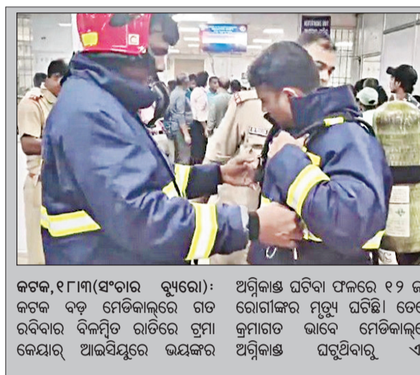
କଟକ, ୧୮ମାର୍ଚ୍ଚ(ସଂଚାର ବ୍ୟୁରୋ): ଅଗ୍ନିକାଣ୍ଡ ଘଟିବା ଫଳରେ ୧୨ ଜଣ କଟକ ବଡ଼ ମେଡିକାଲରେ ଗତ ରବିବାର ବିକଳିତ ରାତିରେ ଚୁମ୍ବିତ ହୋଇଥିବା ଆଇସିୟୁରେ ଭୟଙ୍କର ଅଗ୍ନିକାଣ୍ଡ ଘଟିଥିବା ବାବୁରୁଦ୍ଧା ଏହା