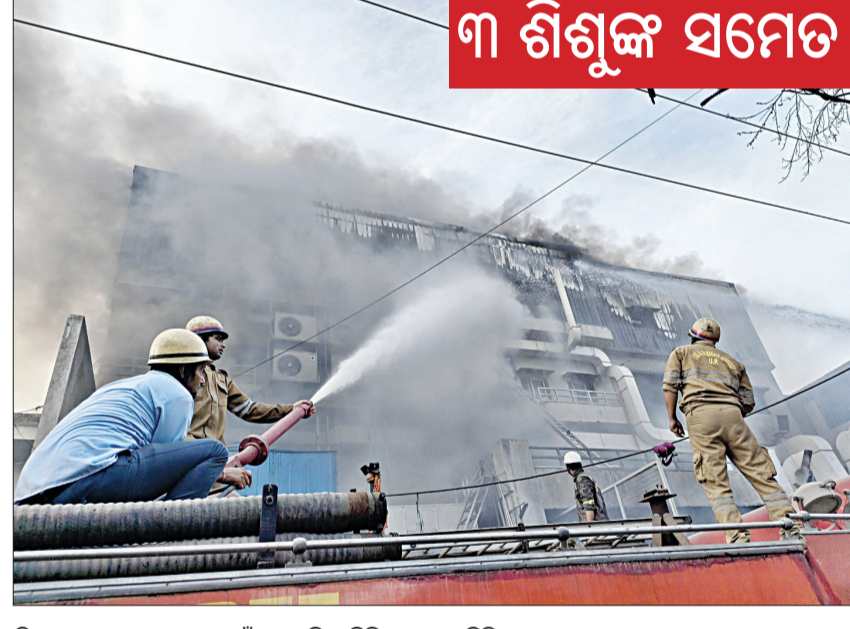
ଭିତରେ ଅନେକ ଲୋକ ଧୂଆଁରେ ଫସି ରହିଥିଲେ। କିଛି ଲୋକ ହେଲେ ଘଟଣାସ୍ଥଳରେ ସେମାନଙ୍କ ଉଦ୍ଧାରକାରୀ ଦଳ ସେମାନଙ୍କୁ ବାହାରକୁ ବାହାର ମଧ୍ୟରୁ ୬ ଜଣଙ୍କ ମୃତ୍ୟୁ ହୋଇଛି। ଅନ୍ୟମାନଙ୍କୁ

ନୂଆଦିଲ୍ଲୀ, ୧୮ମ: ଦିଲ୍ଲୀରେ ଭୟାବହ ଅଗ୍ନିକାଣ୍ଡ। ହୃଦୟରୁ ହୋଇ ଜଳିଲା ୫ ମହଲା କୋଠା। ଦିଲ୍ଲୀର ପାଲମ ଅଞ୍ଚଳରେ ଏହି ଭୟଙ୍କର ଅଗ୍ନିକାଣ୍ଡ ଘଟିଛି। ଏକ ପାଞ୍ଚ ମହଲା ବିଶିଷ୍ଟ କୋଠାରେ ନିଆଁ ଲାଗିଯିବା ଫଳରେ ୬ ଜଣଙ୍କ ମୃତ୍ୟୁ ହୋଇଛି। ସେହିପରି ଅନେକ ଗୁରୁତର ଆହତ ହୋଇଛନ୍ତି। ଉଦ୍ଧାର କରାଯାଇଥିବା ଲୋକଙ୍କ ମଧ୍ୟରେ ତିନି ଜଣ ଶିଶୁ ଅଛନ୍ତି। ଯେଉଁମାନଙ୍କୁ ଅଧିକ ଚିକିତ୍ସା ପାଇଁ ହସ୍ପିଟାଲକୁ ପଠାଯାଇଛି। ଆଗକୁ ମୃତ୍ୟୁ ସଂଖ୍ୟା ବୃଦ୍ଧି ପାଇବା ନେଇ ସମ୍ଭାବନା ରହିଛି। କୁହାଯାଉଛି ଏକ କମ୍ପେଟିଟିଭ୍ ଦୋକାନରେ ନିଆଁ ଲାଗିବା ପରେ ଅଗ୍ନିକାଣ୍ଡ ଘଟିଛି। ଦିଲ୍ଲୀ ଅଗ୍ନିଶମ ବାହିନୀ ଘଟଣାସ୍ଥଳରେ ପହଞ୍ଚି ଉଦ୍ଧାର ଏବଂ ରିଲିଫ୍ କାର୍ଯ୍ୟ ଆରମ୍ଭ କରିଛି।