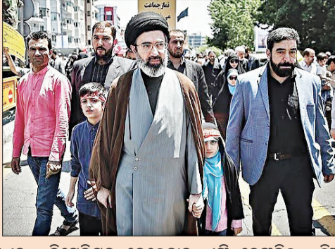
ବ୍ରିଗେଡିୟର ଜେନେରାଲ ଏଫି ଡେଫରିନ୍ ନିଆସିବ ବୋଲି କହିଛନ୍ତି। ଇସ୍ରାଏଲ ଉପରେ ଏହି ଆକ୍ରମଣ ନିର୍ଦ୍ଦେଶ ଦେଇଛନ୍ତି ଓ ଅନୁପାଳନ କରିବା ପରିହେବ।

ଇସ୍ରାଏଲ, ୧୮ମ: ମୋଜତବାଙ୍କୁ ହତ୍ୟା କରିବାକୁ ଇସ୍ରାଏଲର ଶପଥ। ସୁକ୍ଷ୍ମ ଚିନି ସଂହାର ହୋଇଥିବାବେଳେ ଈରାନର ସର୍ବୋଚ୍ଚ ନେତା ଆୟାତୋଲା ମୋଜତବା ଖେମିନି ଯେଉଁଠି ଦି ଥାଆନ୍ତୁ ତାଙ୍କୁ ଖୋଜି ହତ୍ୟା କରିବାକୁ ଶପଥ ନେଇଛି ଇସ୍ରାଏଲ ସେନା। ଇସ୍ରାଏଲିକ ଗଣରାଜ୍ୟ ଈରାନର ଶକ୍ତିଶାଳୀ ଜାତୀୟ ସୁରକ୍ଷା ମୁଖ୍ୟ ଅଲି ମୁଲାନିଙ୍କୁ ଇସ୍ରାଏଲ ଏୟାର ଫୋର୍ସରେ ହତ୍ୟା କରିବା ପରେ ଇସ୍ରାଏଲ ଚାର୍ଜେଜ୍ କରିଛି, ଆମେ ମୋଜତବାଙ୍କ