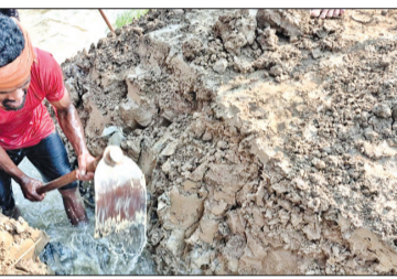
ତାଳଚୁଆ ସାମୁଦ୍ରିକ ଥାନାରେ ମାମଲା

ରାଜନଗର, ୨୮ମାର୍ଚ୍ଚ (ସଂଚାର ବ୍ୟୁରୋ): ଭିତରକନିକା ଅଞ୍ଚଳରୁ ଆଜି ବେଆଇନ ଚିକ୍ଷୁଡ଼ି ଉଚ୍ଛେଦ ବେଳେ ବନ ବିଭାଗ ମାଡ଼ ମରାଯାଇଛି । ଚିକ୍ଷୁଡ଼ି ଘେରି ଭଙ୍ଗା ଯାଉଥିବା ବେଳେ ଫାଇନାଲ୍‌ସ୍‌ ଓ ବାହାର ଲୋକ ପହଞ୍ଚି ବନ କର୍ମଚାରୀଙ୍କୁ ବିରୋଧ କରିବା ସହ ମାଡ଼ ମରାଉଛନ୍ତି । ବନକର୍ମଚାରୀ ଗୁରୁତର ଆହତ ହୋଇଛନ୍ତି । ମାନ୍ୟବର ହାଇକୋର୍ଟଙ୍କ ନିର୍ଦ୍ଦେଶରେ ଚିକ୍ଷୁଡ଼ି ଘେରି ଭଙ୍ଗା ଯାଉଥିବା ବେଳେ ବନ କର୍ମଚାରୀଙ୍କୁ ଆକ୍ରମଣ ଆରୋପନ ପୂର୍ଣ୍ଣ କରିଛି । ଏନେଇ ବନବିଭାଗ ପକ୍ଷରୁ ତାଳଚୁଆ ସାମୁଦ୍ରିକ ଥାନାରେ ଲିଷ୍ଟିତ ଅଭିଯୋଗ କରାଯାଇଛି । ଆଜି ବେଆଇନ ଚିକ୍ଷୁଡ଼ି ଘେରି ଭାଙ୍ଗିବାକୁ ବନବିଭାଗ ଟିମ ଗୋପାଳଜୀଉପଟଣାରେ ପହଞ୍ଚିଥିଲା । ପ୍ରଥମ ଘେରି ଭାଙ୍ଗି ସାରି ଦିତୀୟ ଘେରି ଭାଙ୍ଗିବା ବେଳକୁ ହଠାତ୍