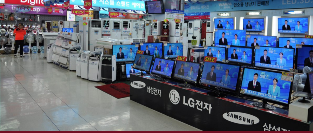
ନୂଆଦିଲ୍ଲୀ, ୨୮ ମାର୍ଚ୍ଚ: ଏଲପିଜି ସଙ୍କଟ ଭିତରେ ଜନତାଙ୍କୁ ବହୁ ଜଳଦି ଆଉ ଏକ ଝଟକା ଲାଗିବାକୁ ଯାଉଛି। ପଶ୍ଚିମ ଏସିଆରେ ଚାଲୁଥିବା ଏହି ଯୁଦ୍ଧ ଯୋଗୁଁ ବର୍ତ୍ତମାନ ଭାରତର ସରକାର ଇଲେକ୍ଟ୍ରୋନିକ୍ସ ବଜାର ପ୍ରଭାବିତ ହେବାକୁ ଯାଉଛି।

ଯୁଦ୍ଧ ଯୋଗୁଁ ବର୍ତ୍ତମାନ ଭାରତର ସରକାର ଇଲେକ୍ଟ୍ରୋନିକ୍ସ ବଜାର ପ୍ରଭାବିତ ହେବାକୁ ଯାଉଛି। ଯାହାଫଳରେ ବହୁ ଜଳଦି ସମଗ୍ର ଇଲେକ୍ଟ୍ରୋନିକ୍ସ ଉତ୍ପାଦ ଅର୍ଥାତ୍ ଏସି, ଟିଭି, ନେଇ ଡ୍ରାସିଂମେସିନ ଯାଏଁ ବର ବଜାରକୁ ଯାଉଛି। ଚିପ୍ସର ମୂଲ୍ୟ ବୃଦ୍ଧି, ଦେଶର ରାଜଧାନୀ ଦିଲ୍ଲୀରେ ଥିବା ଏସିଆର ସର୍ବ ପ୍ରଭାବିତ ଇଲେକ୍ଟ୍ରୋନିକ୍ସ ବଜାର ଓଲୁ ଲାଜପତ ରାୟ ବଜାରରେ