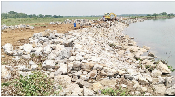
ସୁତନା ଫଳକ ନା ରହିଛି କୌଣସି ଅଧିକାରୀ । ସବୁଠୁ ବଡ଼ କଥା ହେଲା ଏହି ନଦୀରେ କୁମ୍ଭିରୀ ବେଳେ ତାହା ଅତି ନିମ୍ନମାନର କାର୍ଯ୍ୟ ହୋଇଥିବା

ଆଳି, ୧୦।୪ (ସଂଚାର ବ୍ୟୁରୋ): ଖରସୋଡ଼ା ନଦୀ ବାଧା ଖାଲ ଯିବାରୁ ଗାଁ ଆଡ଼କୁ ବିପଦ ଥିବାବେଳେ ବାଧା ଜମି ନଦୀ ଗର୍ଭରେ ଲାଜ ହୋଇ ଯିବାରୁ ଗ୍ରାମ ବାସୀ ସରକାରଙ୍କ ଦୃଷ୍ଟିକୁ ଆଣିବା ପରେ ଏହାକୁ ସୁରକ୍ଷା ଦେବାକୁ ସରକାର ଅର୍ଥ ମଞ୍ଜୁରୀ କରିଥିଲେ । ମାତ୍ର ସୁରକ୍ଷା ଦାୟିତ୍ୱରେ ଥିବା ଆଳି ତଟ ବନ୍ଧ ଓ ଠିକାଦାର ମଧୁରହାଣିକାର ନିମ୍ନମାନର ପଥର ପ୍ୟାକିଂ ହେଉଥିବା ଅଭିଯୋଗ ଆଣିଛନ୍ତି ଗ୍ରାମବାସୀ । ପଥର ପ୍ୟାକିଂ ନାମରେ ବାଲିଛି ଠିକାଦାର ଘୋଷଣା । ନିଦା ବିଷ୍ଣୁ ସାଜିଛନ୍ତି ତଟ ବନ୍ଧ ଅଧିକାରୀ ।