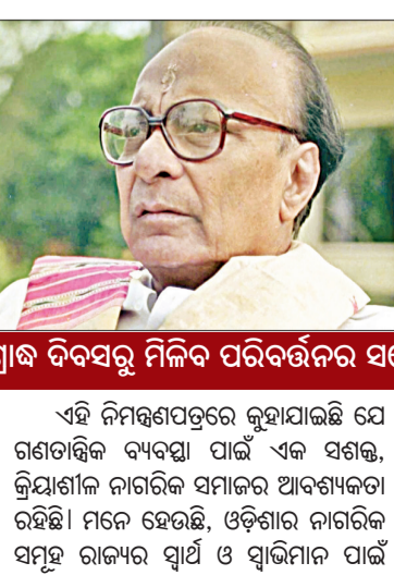
ବିଲ୍ ଶ୍ରାବ୍ଧ ବିବସରୁ ମିଳିବ ପରିବର୍ତ୍ତନର ସଙ୍କେତ