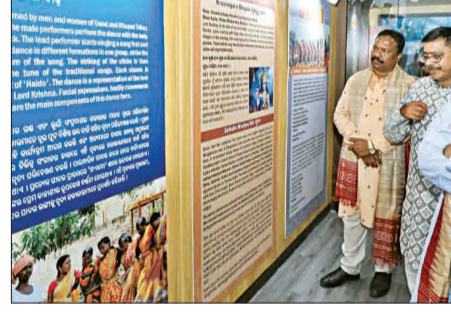
କେନ୍ଦ୍ର ମନ୍ତ୍ରୀଙ୍କ ଦ୍ଵାରା 'ବୀର ସୁରେନ୍ଦ୍ର ସାଏ ସଂଗ୍ରହାଳୟ' ଲୋକାର୍ପିତ

ସମ୍ବଲପୁର, ୧୫/୪ (ସଂଚାର ବ୍ୟୁରୋ): ମହାନ ସ୍ଵାଧୀନତା ସଂଗ୍ରାମୀ ବୀର ସୁରେନ୍ଦ୍ର ସାଏ ଶୌର୍ଯ୍ୟ, ଯୌର୍ଯ୍ୟ ଓ ପରାକ୍ରମର ପ୍ରତୀକ। ସମ୍ବଲପୁର ଘୋରପଡ଼ାଠାରେ ଲୋକାର୍ପିତ ହୋଇଥିବା 'ବୀର ସୁରେନ୍ଦ୍ର ସାଏ ସଂଗ୍ରହାଳୟ' ଆଗାମୀ ପିଢ଼ିକୁ ନିଜର ଐତିହ୍ୟ ଓ ଇତିହାସ ବିଷୟରେ ଜାଣିବା ପାଇଁ ପ୍ରେରିତ କରିବ ବୋଲି କେନ୍ଦ୍ର ଶିକ୍ଷା ମନ୍ତ୍ରୀ ତଥା ସମ୍ବଲପୁର ସଂସଦ ଧର୍ମେନ୍ଦ୍ର ପ୍ରଧାନ କହିଛନ୍ତି। ଦୁଇଦିନିଆ ସମ୍ବଲପୁର ୯୫ ପୁଣ୍ୟ-୬