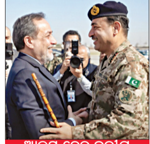
ଆସିମ୍ ହେବ ବୃତ୍ତୀୟ ପର୍ଯ୍ୟାୟ ଶାନ୍ତି ଆଲୋଚନା!

ତେହରାନ, ୧୫/୪: ଗତ ସପ୍ତାହରେ ଇସଲାମାବାଦରେ ଆମେରିକା-ଇରାନ୍ ମଧ୍ୟରେ ଶାନ୍ତି ଆଲୋଚନା ହୋଇଥିଲେ ହେଁ ଦୀର୍ଘ ଘଣ୍ଟା ପରିଶ୍ରମ ବେକାର ସାବ୍ୟସ୍ତ ହୋଇଥିଲା। ତେବେ ପୁଣିଥରେ ଶାନ୍ତି ଦାବୀ ନେଇ ପାକିସ୍ତାନ ସେନାମୁଖ୍ୟ ଅସୀମ ମୁନୀର ଆଜି ଇରାନ୍ ରାଜଧାନୀ ତେହରାନରେ ପହଞ୍ଚିଛନ୍ତି। ଆମେରିକା ଓ ଇରାନ ମଧ୍ୟରେ ଉତ୍ତରାଧିକାରୀ ହାସଲ କରିବା ପାଇଁ ପାକିସ୍ତାନର ମଧ୍ୟସ୍ଥି ଲୁମିକାର ଅଂଶ ଭାବେ ପାକିସ୍ତାନର ସେନା ମୁଖ୍ୟ ଫିଲ୍ଡ ମାର୍ଶାଲ୍ ମୁନିର ଏବଂ ମନ୍ତ୍ରୀ ମହସିନ ନକଭା ଆଜି ତେହରାନରେ ଅବତରଣ କରିଛନ୍ତି।