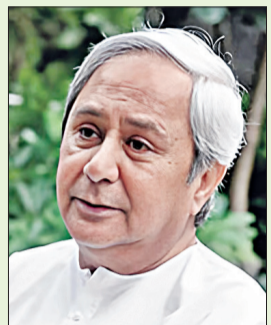
ବିଧାନସଭାର ସ୍ଵତନ୍ତ୍ର ଅଧିବେଶନ ଡାକିବାକୁ ପ୍ରତ୍ୟାବ

ସୀମା ପୁନଃନିର୍ଦ୍ଧାରଣରେ ଓଡ଼ିଶାର ସ୍ଵାର୍ଥ ରକ୍ଷା ପାଇଁ ବିଧାନସଭାର ସ୍ଵତନ୍ତ୍ର ଅଧିବେଶନ ଡାକିବାକୁ ବିରୋଧୀ ଦଳ ନେତା ନବୀନ ପଟ୍ଟନାୟକ ଡାକି କରିଛନ୍ତି। ଏନେଇ ସେ ମୁଖ୍ୟମନ୍ତ୍ରୀ ମୋହନ ଚରଣ ମାଣିଙ୍କୁ ଆଜି ଏକ ଚିଠି ଲେଖିଛନ୍ତି। ୪୮ ଘଣ୍ଟା ମଧ୍ୟରେ ବିଧାନସଭାର ସ୍ଵତନ୍ତ୍ର ଅଧିବେଶନରେ ଓଡ଼ିଶାର ସ୍ଵାର୍ଥ ରକ୍ଷା ପାଇଁ ଏକ ସଙ୍କଳ୍ପ ପାରିତ କରାଯାଉ ବୋଲି ଶ୍ରୀ ପଟ୍ଟନାୟକ ପ୍ରତ୍ୟାବ ଦେଇଛନ୍ତି। ଆସନଗୁଡ଼ିକରୁ ଆରମ୍ଭ ହେବାକୁ ଥିବା ସଂସଦର ସ୍ଵତନ୍ତ୍ର ଅଧିବେଶନରେ ମହିଳା ସଂରକ୍ଷଣ ବିଲ୍ ନେଇ ଆଲୋଚନା ହେବ। ଏହାକୁ ବିଜେଡି ସମର୍ଥନ କରିବ। କାରଣ ମହିଳାଙ୍କ ପାଇଁ ସଂରକ୍ଷଣକୁ ବିଜେଡି ସର୍ବାଧିକ ଗୁରୁତ୍ଵ ଦେଇଛି। ବିଲ୍‌କୁ ମହିଳାଙ୍କ ପାଇଁ ପଞ୍ଚାୟତରେ ୩୩ ପ୍ରତିଶତ ସଂରକ୍ଷଣ କରିଥିବା ବେଳେ ବିଜେଡି ସରକାର ୫୦ ପ୍ରତିଶତକୁ ବଢ଼ି କରିଥିଲେ। ଏପରିକି ମହିଳାଙ୍କ ପାଇଁ ସଂସଦ ଓ ବିଧାନସଭାରେ ୩୩ ପ୍ରତିଶତ ସଂରକ୍ଷଣ ପାଇଁ ଓଡ଼ିଶା ବିଧାନସଭାରେ ସ୍ଵତନ୍ତ୍ର ପ୍ରସ୍ତାବ ପାରିତ କରାଯାଇ ୨୨ ରାଜ୍ୟର ସମର୍ଥନ ନିଆଯାଇଥିଲା ବୋଲି ସେ କହିଛନ୍ତି। ସେହିଭଳି ୯୫ ପୁଣ୍ୟ-୬