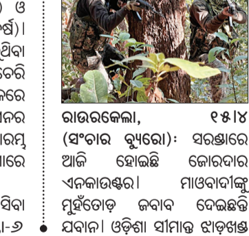
ରାଉରକେଲା, ୧୫/୪ (ସଂଚାର ବ୍ୟୁରୋ): ସରଞ୍ଚାରେ ଆଜି ହୋଇଛି କୋରଦାର ଏନ୍‌କାଉଣ୍ଟର୍। ମାଓବାଦୀଙ୍କୁ ମୁହଁତୋଡ଼ି କରାବ ଦେଇଛନ୍ତି ଯବାନ। ଓଡ଼ିଶା ସାମାଜ୍ୟ ଖାତାରେ