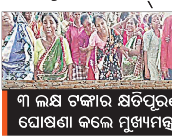
୩ ଲକ୍ଷ ଟଙ୍କାର କ୍ଷତିପୂରଣ ଘୋଷଣା କଲେ ମୁଖ୍ୟମନ୍ତ୍ରୀ