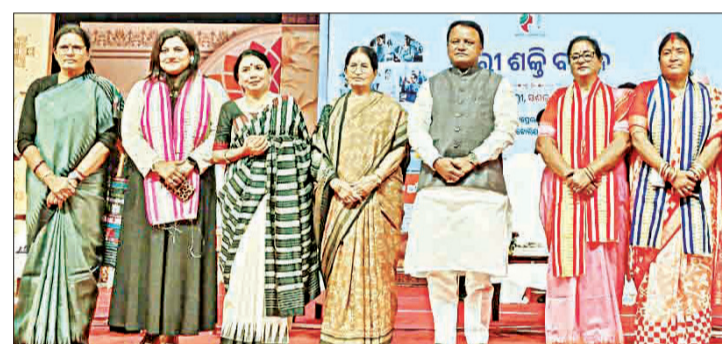
ରାଜ୍ୟ ସରକାରଙ୍କୁ ନିମ୍ନଲିଖିତ କାର୍ଯ୍ୟକ୍ରମରେ ମୁଖ୍ୟମନ୍ତ୍ରୀଙ୍କୁ ସମ୍ମାନିତ କରାଯାଇଛି।

ଭୁବନେଶ୍ଵର, ୧୫/୪ (ସଂଚାର ବ୍ୟୁରୋ): ପ୍ରଧାନମନ୍ତ୍ରୀ ନରେନ୍ଦ୍ର ମୋଦି ଭାରତୀୟ ସଂସ୍କୃତି ଓ ପରମ୍ପରା ପ୍ରତି ସମ୍ମାନ ଜଣାଇ