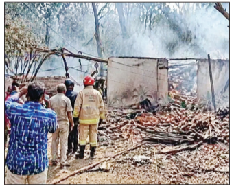
୨ ଲକ୍ଷ ଟଙ୍କାର କ୍ଷତିପୂରଣ ଯୋଷଣା କଲେ ପ୍ରଧାନମନ୍ତ୍ରୀ

ସୂଚନାମୁତାବେ, କେରଳ ତ୍ରିପୁରା ନିକଟସ୍ଥ ମୁଖୁଥିଲୋଡ଼ ଅଞ୍ଚଳରେ ଏକ ବାଣ ତିଆରି ଯୁଗ୍ମରେ ଭୟଙ୍କର ଅଗ୍ନିକାଣ୍ଡ ଏବଂ ସିରିକ୍ ବିସ୍ଫୋରଣ ଘଟି ଅତି କମରେ ୧୫ ଜଣଙ୍କର ମୃତ୍ୟୁ ଘଟିଛି। ଆଜି ଅପରାହ୍ଣ ପ୍ରାୟ ସାଢ଼େ ୩ଟା ସମୟରେ ଘଟଣା ଘଟିଥିବା ଏହି ବିସ୍ଫୋରଣରେ ୪୦ରୁ ଅଧିକ ଶ୍ରମିକ ଆହତ ହୋଇଛନ୍ତି। ସହରରେ ଆୟୋଜିତ ଦୀର୍ଘ ସମୟର ପହରାଣ ଶ୍ରମିକ ପୁରୁଷ ଥିବାବେଳେ ଶେଷା ପାଇଁ ପ୍ରାୟ ୫ ଏକର ଧାନ କ୍ଷେତରେ ବାଣ ପ୍ରସ୍ତୁତ ହେଉଥିଲା। ବିସ୍ଫୋରଣ ଘଟିବା ଫଳରେ ବଡ଼ ଧରଣର ଅଗ୍ନିକାଣ୍ଡ ଘଟିଥିଲା ଓ ଚାହୁଁ ଚାହୁଁ ନିଆଁ ଚାରିଆଡ଼େ ବ୍ୟାପିଯାଇଥିଲା। ସେତେବେଳେ କାରଖାନାର ୮ଟି ସେକ୍ଟର ମଧ୍ୟରୁ ୫ଟିରେ ନିଆଁ ଲାଗିଯାଇଥିଲା। ସେଥିମଧ୍ୟରୁ ତିନୋଟି ସେକ୍ଟର ବିପୁଳ ପରିମାଣର ବିସ୍ଫୋରଣ ସାମଗ୍ରୀ ଥିବାରୁ ସିରିକ ବିସ୍ଫୋରଣ ଘଟିଥିଲା। ଏହାର ୯ ପୃଷ୍ଠା-୬