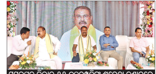
ସମ୍ବଲପୁର ଜିଲ୍ଲାର ୨୨ ନବଦମ୍ପତ୍ତିଙ୍କୁ ଶୁଭେଚ୍ଛା ଜଣାଇଲେ

ସମ୍ବଲପୁର, ୨୧୪ (ସଂଚାର ବ୍ୟୁରୋ): ସମ୍ବଲପୁର ଧନୁପାଲିକ୍ଷିତ ଆଦିତ୍ୟ କନ୍ୟାମଣ୍ଡଳରେ ଆଜି ‘ମୁଖ୍ୟମନ୍ତ୍ରୀ କନ୍ୟା ବିବାହ ଯୋଜନା’ ଅନ୍ତର୍ଗତ ଏକ ମାନବିକ ତଥା ପବିତ୍ର କାର୍ଯ୍ୟକ୍ରମ ଅନୁଷ୍ଠିତ ହୋଇଛି। ଏହି ଅବସରରେ କେନ୍ଦ୍ର ଶିକ୍ଷା ମନ୍ତ୍ରୀ ତଥା ସମ୍ବଲପୁର ସାଂସଦ ଧର୍ମେନ୍ଦ୍ର ପ୍ରଧାନ ଏକ ଭିତ୍ତି ଓ ବାର୍ତ୍ତା ମାଧ୍ୟମରେ ନବଦମ୍ପତ୍ତିଙ୍କୁ ଶୁଭେଚ୍ଛା ଜଣାଇବା ସହ ଯୋଜନାକୁ ସରକାରଙ୍କ ସମ୍ପୂର୍ଣ୍ଣ ସମର୍ଥନ ପରିଚୟ ବୋଲି ଅଭିହିତ କରିଛନ୍ତି। ସମ୍ବଲପୁର ଜିଲ୍ଲାର ବିଭିନ୍ନ ବ୍ଲକ ଓ ମ୍ୟୁନିସିପାଲିଟି ଅଞ୍ଚଳର ୨୨ ନବଦମ୍ପତ୍ତି ଆଜି ବିବାହ ବନ୍ଧନରେ ବାନ୍ଧି ହୋଇ ଏକ ନୂତନ ଜୀବନ ଆରମ୍ଭ କରିଛନ୍ତି। କେନ୍ଦ୍ର ମନ୍ତ୍ରୀ ଶ୍ରୀ ପ୍ରଧାନ ନିଜ ବାର୍ତ୍ତାରେ କହିଛନ୍ତି ଯେ ଏହା କେବଳ ଏକ ସରକାରୀ କାର୍ଯ୍ୟକ୍ରମ ନୁହେଁ, ବରଂ