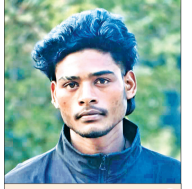
ସହାୟତା ଯୋଗାଇଦେବାକୁ ଦାବି