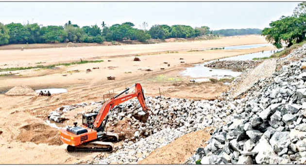
ପରେ ସେଠାରେ ସ୍ତର କାର୍ଯ୍ୟ ବନ୍ଦ କରାଯାଇଥିଲା । ଅଧୀକ୍ଷଣ ଯତ୍ନ ତଦନ୍ତ କରାଇବା ବଦଳରେ ଠିକା ମାତ୍ର କିଛି ଦିନ ପରେ ଠିକା ସଂସ୍ଥା କିଛି ଲୋକଙ୍କୁ ସଂସ୍ଥାର ପକ୍ଷ ପାଲଟିଛନ୍ତି ।

କେନ୍ଦ୍ରାପଡ଼ା, ୨୪।୪ (ସଂଚାର ବ୍ୟୁରୋ): ଯୋଜନାରେ ତଞ୍ଜକତା ଅଭିଯୋଗ । କୋଣସି ପୁନି ନଥାଇ ଠିକା ସଂସ୍ଥା ପ୍ରତିରେ ପଥର ସ୍ତର ନିର୍ମାଣ କରୁଛି ମହାନଦୀ ଉତ୍ତର ବିଭାଜନ-୧ । କେନ୍ଦ୍ରାପଡ଼ା ଜିଲ୍ଲା ତେରାବିଶ ବ୍ଲକ୍ ଅନ୍ତର୍ଗତ ଭଦ୍ରା ପଞ୍ଚାୟତରାଜ ପୁରୁଷୋତ୍ତମପୁର ଠାରେ ହେଉଥିବା କରାଣ୍ଡିଆ ନଦୀବନ୍ଧ ସୁରକ୍ଷା କାର୍ଯ୍ୟରେ ଏକଳ ତଞ୍ଜକତା ହେଉଥିବା ଅଭିଯୋଗ ହୋଇଛି । ପ୍ରଥମେ କାର୍ଯ୍ୟସ୍ଥଳରେ କେବଳ ପଥର ପାଲିଂ ଓ ଲଞ୍ଚିଂ ପାଇଁ ଯୋଜନା ହୋଇ କାର୍ଯ୍ୟାଦେଶ ମିଳିଥିବା କଥା ନିଜେ ବିଭାଗୀୟ ଯତ୍ନ ମନୋରଞ୍ଜନ ମହାନ୍ତି ପ୍ରକାଶ କରିଥିଲେ । ସେହି କାର୍ଯ୍ୟସ୍ଥଳରେ ପ୍ରଥମେ ଦୁଇଟି ପଥର ସ୍ତର ନିର୍ମାଣ କାର୍ଯ୍ୟର ଖବର ପ୍ରକାଶ