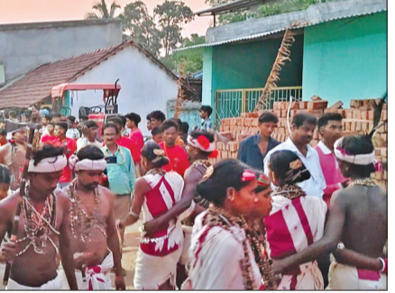
ବାସ କାମରେ ବ୍ୟବହୃତ ହଳ, ଲଙ୍ଗଳ, କୋଡ଼ି, କୋଦାଳକୁ ବୋହି ଏକ ବିଶାଳ ଶୋଭାଯାତ୍ରାରେ ଗ୍ରାମ ପରିକ୍ରମାରେ ବାହାରି ଧାର୍ଯ୍ୟ ସମୟ ଅନୁଯାୟୀ ଦେବାଙ୍କ ପାଖରେ ପୂଜାର୍ଚ୍ଚନା କରାଯାଇଛି। ବାଲିରେ ଶ୍ୟାମ ଯାତ ତୁବ୍ୟ ଯଥା ଧାନ, ରହମ, ମାଣ୍ଡିଆ, ମକା, ଖୁଆଁ, ମୁତ, ବିରି ଆଦି ବୁଣାଯାଏ। ଯେଉଁ ଦିନ ସେହି ବୁଦ୍ଧ୍ୟରୁ ଅଙ୍ଗୁର କାତ ହୁଏ ସେହିଦିନ ବାଲିଯାତ୍ରା ଅନୁଷ୍ଠିତ ହୁଏ। ଏହି ପୂଜା କଲେ ଗାଈ ଗୋରୁ ସହିତ ଲୋକଙ୍କୁ କୌଣସି ରୋଗ ହୁଏ ଏବଂ ତାହା

ବୋରିଗୁଣ୍ଡା, ୨୮୮୪ (ସଂଚାର ବ୍ୟୁରୋ): ଆଧୁନିକ ଯୁଗରେ ମଣିଷ ଭୁଲି ନିଜର କଳା, ସଂସ୍କୃତି ଓ ପରମ୍ପରା। ଏହି ପରମ୍ପରାକୁ ବଜାୟ ରଖିବା ପାଇଁ କୋରାପୁଟ ଜିଲ୍ଲା ବୋରିଗୁଣ୍ଡା ବୁକ୍ସ ପୋଡ଼ାପଦ୍ମ ଗାଁରେ ପାଳନ ହୋଇଛି ଆଦିବାସୀଙ୍କ ବିଶ୍ୱାସ ବହନ କରୁଥିବା ବାଲିଯାତ୍ରା। ପୋଡ଼ାପଦ୍ମ ଗାଁରେ ନିଆଁରା ଜଙ୍ଗଲରେ ଏହି ଯାତ୍ରା ପାଳନ କରିଛନ୍ତି ପିଲାଠୁ ବୟସ୍କ। ୩ ବର୍ଷରେ ଥରେ ପାଳନ ହେଉଥିବା ବାଲିଯାତ୍ରାକୁ ବେଶ୍ ଧୂମ୍ ଧାମରେ ପାଳନ କରାଯାଇଛି। ପୋଡ଼ାପଦ୍ମ ସହିତ ଆଖ ପାଖ ଗାଁରୁ ହଜାର ହଜାର ଲୋକ ରୁଞ୍ଚି ହୋଇ ପାରମ୍ପରିକ ରୀତି ନୀତିରେ ବାଜା ବାଣ ପୁଟାଉବା ସହିତ ବିଭିନ୍ନ ଆଦିବାସୀ ଲୋକ ସଂସ୍କୃତି ପ୍ରଦର୍ଶନ କରି ନାଚ ଗୀତରେ ଧୂମ୍‌ଧାମରେ ଉପସ୍ଥିତ। ଏହି ଅବସରରେ ଆଦିବାସୀଙ୍କ ଦେବତା ଭିମା ଭିମାଙ୍କୁ ପୂଜା କରାଯାଇଛି। ବାଲି ଘରୁ ବାଲି ଚଢ଼ୁଡ଼ିରେ ଗଜା ଶ୍ୟାମଳ ମହାଲୀମାନେ ନିଜ ନିଜର ମୁଣ୍ଡରେ ବୋହି ନେଇଥିବା ବେଳେ ପୁରୁଷମାନେ