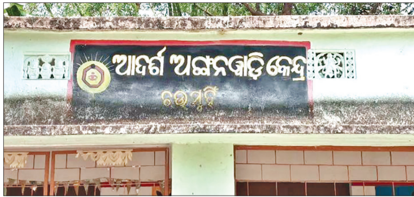
ଚାକି ରହିଥିଲେ ବି ପାଣି ଯୋଗାଣ ବ୍ୟବସ୍ଥା ନାହିଁ। ଅସୁବିଧା ନାହିଁ, ଯାହା ଶିଶୁମାନଙ୍କ ସ୍ୱାସ୍ଥ୍ୟ ପାଇଁ ଗଭୀର ସେହିପରି, ଲାଗିଥିଲେ ବି ତାହା ବ୍ୟବହାର ଯୋଗ୍ୟ ତିକାର ବିଷୟ। ଅଙ୍ଗନବାଡ଼ି ତାରି ପାଖରେ ସୁରକ୍ଷା

ଆନନ୍ଦପୁର, ୨୮୮୪ (ସଂଚାର ବ୍ୟୁରୋ): କେନ୍ଦ୍ରରେ ଜିଲ୍ଲା ଘଷିପୁରା ବୁକ୍ସ ବଳରାମପୁର ପଂଚାୟତ ଅନ୍ତର୍ଗତ ଚମୁହିଁ ଅଙ୍ଗନବାଡ଼ି କେନ୍ଦ୍ରରେ ଦେଶାଦେଶି ଗୁରୁତର ଅବ୍ୟବସ୍ଥା। ସରକାରୀ ଯୋଜନାରେ ଗଢ଼ିଉଠିଥିବା ଏହି କେନ୍ଦ୍ରରେ ଆବଶ୍ୟକ ସୁବିଧା ଥିଲେ ବି ସେଗୁଡ଼ିକ କାର୍ଯ୍ୟକାରୀ ହେଉନଥିବାରୁ ଶିଶୁମାନେ ଭୋଗୁଛନ୍ତି ଅସୁବିଧା। ଅଙ୍ଗନବାଡ଼ି ଗୃହରେ ବିଦ୍ୟୁତ୍ ବୋର୍ଡ ଲାଗିଥିଲେ ମଧ୍ୟ ବିଦ୍ୟୁତ୍ ସଂଯୋଗ ନଥିବାରୁ ଗରମ ଦିନରେ ଶିଶୁମାନେ ଛଟପଟ ହେଉଛନ୍ତି। ପାଣି ପାଇଁ ଛାତ୍ର ଉପରେ ଚାକି ରହିଥିଲେ ବି ପାଣି ଯୋଗାଣ ବ୍ୟବସ୍ଥା ନାହିଁ। ଅସୁବିଧା ନାହିଁ, ଯାହା ଶିଶୁମାନଙ୍କ ସ୍ୱାସ୍ଥ୍ୟ ପାଇଁ ଗଭୀର ସେହିପରି, ଲାଗିଥିଲେ ବି ତାହା ବ୍ୟବହାର ଯୋଗ୍ୟ ତିକାର ବିଷୟ। ଅଙ୍ଗନବାଡ଼ି ତାରି ପାଖରେ ସୁରକ୍ଷା