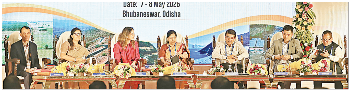
Date: 7-8 May 2026 Bhubaneswar, Odisha

ଭୁବନେଶ୍ୱର, ୭।୫ (ସଂଚାର ବ୍ୟୁରୋ): ଗ୍ରାମୀଣ ରାସ୍ତା ସଫଳ ଯୋଜନା (ବିଏମଜିଏସଫାଇ) ଉପରେ ଭୁବନେଶ୍ୱର ଆଞ୍ଚଳିକ ସମୀକ୍ଷା ବୈଠକ ଆଜି ଏଠାରେ ଆରମ୍ଭ ହୋଇଛି।