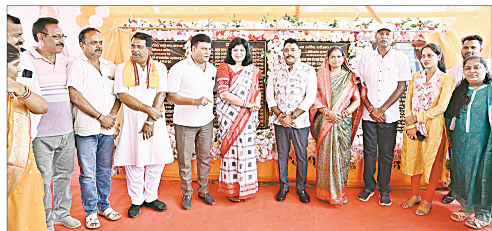
କାର୍ଯ୍ୟ ପାଇଁ ଦଳ ମତ ନିର୍ଦ୍ଦେଶରେ ପ୍ରକଳ୍ପ ମିଳି ମିଶି କାର୍ଯ୍ୟ କରିବାକୁ ସେ ଆହ୍ୱାନ ଦେଇଛନ୍ତି। ଏଥିସହ ଜଣେ ପୌରାଞ୍ଚଳରେ ଶିଳାମାଧ୍ୟ ହୋଇଥିବା ବିନୋଦନ ସୁଧିଧା ସୂଚି ହେବା ସହ ଏହି ପ୍ରକଳ୍ପଗୁଡ଼ିକ ମାଧ୍ୟମରେ ଗ୍ରାମୀଣ ଅଞ୍ଚଳର ସାମଗ୍ରିକ ଉନ୍ନତି ହେବ ବୋଲି ସେ କହିଥିଲେ।

ରଥରାୟଣା ଯୁବକ ସଂଘ ଓ ଖେଳ ପଡ଼ିଆ ପାଇଁ ୧୭.୨୨ ଲକ୍ଷ ଟଙ୍କା ବ୍ୟୟରେ ଉନ୍ନୟନ କାର୍ଯ୍ୟର ଶିଳାମାଧ୍ୟ କରାଯାଇଛି। ଏଥିସହ ଓଡ଼ିଶା ନଗର ଗଠନ ଓ ଉନ୍ନୟନ ଆଇନ ୨୦୧୧ ଲକ୍ଷ ଟଙ୍କା ବ୍ୟୟ ଅଟକଳରେ ଷ୍ଟାର୍ଟ କ୍ୱାର୍ଟର ପାଇଁ ମଧ୍ୟ ଶିଳାମାଧ୍ୟ କରିଛନ୍ତି ସଂସଦ। ଏ ନେଇ ଆୟୋଜିତ ଏକ କାର୍ଯ୍ୟକ୍ରମରେ ପ୍ରକଳ୍ପ ଓ ତାହାର ବିଭିନ୍ନ ଦିଗ ଗୁଡ଼ିକୁ ନେଇ ଆଲୋଚନା କରାଯାଇଥିବା ବେଳେ ରାଜ୍ୟରେ ଉତ୍କଳ ଉତ୍ତୀନ ସରକାର ଯିବାକୁ ସମସ୍ତ କାର୍ଯ୍ୟ ସୁଧିଧାରେ ହେଉଥିବା ଭୁବନେଶ୍ୱର ସଂସଦ ଅପରାଜିତା ସୂଚନା ଦେଇଛନ୍ତି। ବର୍ତ୍ତମାନ ସରକାର ଲୋକଙ୍କ ନିଶ୍ଚିତରେ ବିଭିନ୍ନ ପ୍ରକଳ୍ପ କରୁଥିବା ବେଳେ ବିକାଶ ମୂଳକ