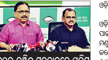
ଭବଲ ଉତ୍ତୀନ ସରକାରରେ ପୁଲିସ ଏବେ ଅସହାୟ କାହିଁକି?