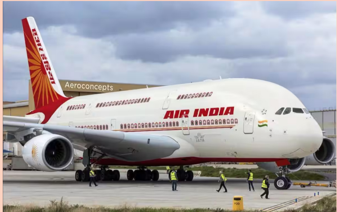
ନୂଆଦିଲ୍ଲୀ, ୧୩:୫- ମଧ୍ୟପ୍ରାଚ୍ୟ ସଂକଟର ପ୍ରଭାବ ସାରା ଦୁନିଆରେ ପଡ଼ିବା ଆରମ୍ଭ ହେଲାଣି। ବିଶେଷ କରି ଉଡ଼ାଣ ଶୁଖିଲା ସମ୍ପର୍କରେ ପ୍ରଭାବ ପଡ଼ିଛି। ଅଗୋପିତ ତୈଳ ମୂଲ୍ୟ ଆକାଶକୁ ଉଠାଇଛି। ସେପଟେ ବିମାନ ଇନ୍ଦନ ମୂଲ୍ୟ ମଧ୍ୟ ବୃଦ୍ଧି ପାଇଛି। ଏହି କାରଣରୁ ଏୟାର ଇଣ୍ଡିଆ ଜୁନ୍ ଆରମ୍ଭରୁ ଆଗାମୀ ତିନି ମାସ ଯାଏଁ ଅନ୍ତର୍ଜାତୀୟ ଉଡ଼ାଣ ବାତିଲ କରିବା ପାଇଁ ନିଷ୍ପତ୍ତି ନେଇଛି। ରିପୋର୍ଟ