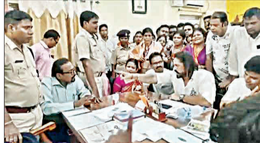
ଏବିଡିଓକୁ ଦୂର୍ବ୍ୟବହାର ନେଇ ବିଜେଡିର ବୈଠକ...

କଟକ, ୧୬୫୫ (ସଂଚାର ବ୍ୟୁରୋ): ଶୁକ୍ରବାର କଟକ ଜିଲ୍ଲା ଗଞ୍ଜେଇ ବିଭାଗର ଏବିଡିଓ ଅଧିକାରୀଙ୍କ ଉପସ୍ଥିତିରେ ଏପିଡିଓର ବ୍ୟବହାର ନେଇ ବୈଠକ ଡାକିଥିଲେ।