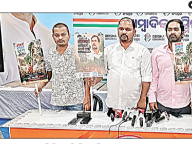
ଉଦ୍ୟମ ଚାଲିଛି। ସିନିଆଲିର ହଜାର ହଜାର ଆଦିବାସୀଙ୍କ ସାଥେ ପୁରୁଷର ଆଦିବାସୀ ବର୍ଗର ଲୋକେ ଜଣେ ଜଣେ ଆଦିବାସୀ ବର୍ଗର ମୁଖ୍ୟମନ୍ତ୍ରୀ ପାଇଁ ଶୁଣି ହୋଇଥିଲେ।

ଭୁବନେଶ୍ୱର, ୧୬୫୫ (ସଂଚାର ବ୍ୟୁରୋ): ଅଧିକ ଓଡ଼ିଶା ପ୍ରଦେଶ ଯୁବ କଂଗ୍ରେସ ପକ୍ଷରୁ ଓଡ଼ିଶା ପ୍ରଦେଶ କାର୍ଯ୍ୟକ୍ରମରେ ରାଜ୍ୟ ଯୁବ କଂଗ୍ରେସ ସଭାପତିଙ୍କ ଅଧ୍ୟକ୍ଷତାରେ ଏକ ସାମ୍ବାଦିକ ସମ୍ମିଳନୀ ଅନୁଷ୍ଠିତ ହୋଇଛି।