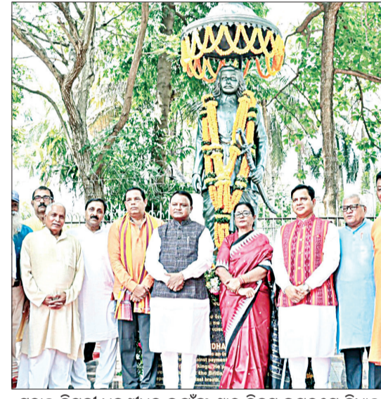
ମହାନ ବିପ୍ଳବୀ ଧରଣୀଧର ଭୂୟାଁଙ୍କ ଶ୍ରାଦ୍ଧ ଦିବସ ଉପଲକ୍ଷେ ବିଧାନସଭା ଏକ ନୂତନ ଗେଟ୍ ନିକଟରେ ଥିବା ପ୍ରତିମୁର୍ତ୍ତିରେ ବାରମ୍ବାର ସୁମନା ପାଠ, ମୁଖ୍ୟମନ୍ତ୍ରୀ ମୋହନ ଚରଣ ମାଝୀ, ଏକାମ୍ର ଭୁବନେଶ୍ୱର ବିଧାନସଭା ସଭ୍ୟ ଓ ବିଧାନସଭା ସଭ୍ୟମାନଙ୍କୁ ପୂଜାମାଳ୍ୟ ଅର୍ପଣ କରି ଶ୍ରଦ୍ଧାଞ୍ଜଳି ଜଣାଯାଇଛି।