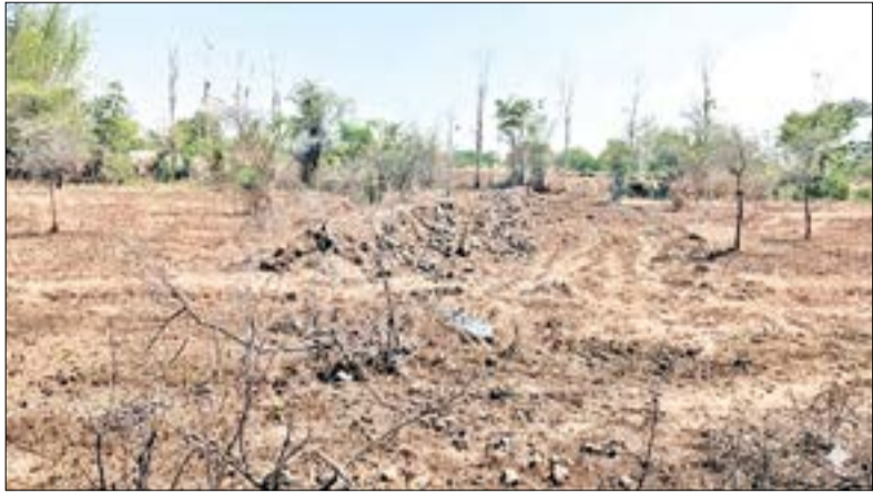
ଲୋଇସିଂହା, ୧୬୫୫(ସଂଚାର ବ୍ୟୁରୋ): ଏବେ ଜମି ବ୍ୟବସାୟୀଙ୍କ ଲୋଲୁପ ଦୃଷ୍ଟି ବଲାଙ୍ଗୀର ଜିଲ୍ଲା ଲୋଇସିଂହା ତହସିଲ ବୃତ୍ତୀ ପଡ଼ିଛି। ବର୍ଷ ବର୍ଷ ଧରି ବ୍ୟବହୃତ ପ୍ରାକୃତିକ ମୌଜାର ଡୋଳମହଲ ଗୋଟର ଜମି ଉପରେ

ପକାଇ ବନ୍ଦ କରି ଦେଉଛନ୍ତି। ବର୍ତ୍ତମାନ ଡୋଳମହଲ ଗୋଟର ଜମିର ଉତ୍ତର ଦିଗରେ ବର୍ଷା ଜଳକୁ ଡାକିଦେଇ ଉଦ୍ଦେଶ୍ୟରେ ବେଆଇନ ଭାବେ ମେଣିନ ଲଗାଇ ମାଟି ଆଡ଼ିବନ୍ଧ ନିର୍ମାଣ କରାଯାଇଛି। ଆଡ଼ିବନ୍ଧ କରିଆରେ ବର୍ଷା ଜଳ ସ୍ରୋତକୁ ଅବରୋଧ କରିବା ଦ୍ୱାରା ବୃତ୍ତୀ ଗ୍ରାମର ବାଷ୍ପଜମିକୁ ଆଉ ବର୍ଷା ଜଳ ମାଟି ପାରିବ ନାହିଁ। ଫଳରେ ସମ୍ପୃକ୍ତ ଅଞ୍ଚଳର ବାଷ୍ପଜମି ପ୍ରଭାବିତ ହେବା ଆଶଙ୍କା ଦେଖାଦେଇଛି। ଏନେଇ ବର୍ଷା ଜଳ ନିକଟରେ ତହସିଲଦାରଙ୍କ ଦ୍ୱାରା ସ୍ୱତନ୍ତ୍ର ପ୍ରକାଶ ପୁସ୍ତକ ମିଳିପାରିନାହିଁ। ଏହାକୁ ନେଇ ବୃତ୍ତୀ ଗ୍ରାମର ବାଷ୍ପ ମହଲରେ ତୀବ୍ର ଅସନ୍ତୋଷ ପ୍ରକାଶ ପାଇଛି। ପ୍ରକାଶ ଯେ, ବଲାଙ୍ଗୀର-ବରଗଡ଼ ୨୬୩ ନଂ ଜାତୀୟ ରାଜପଥ ପାର୍ଶ୍ୱ ମାଛ କାଆଁଳା କେନ୍ଦ୍ର ପଛପଟରୁ ନୂଆ ମେଡ଼ିକାଲ ଯାଏଁ ବିଦ୍ୟୁତ୍ ଗୋଟର ଜମି ରହିଛି। ଲୋଇସିଂହା ଓ ବୃତ୍ତୀ ଗ୍ରାମର ଗାଈଗୋରୁ ଏଠାରେ ବିଚରଣ କରିଥାନ୍ତି। ଗୋଟର ଜମି ଓ