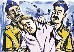
ବିପୁଳ ପରିମାଣର ଗଞ୍ଜେଇ, ଅସ୍ତ୍ର ଓ ଯାନବାହନ ଜବତ