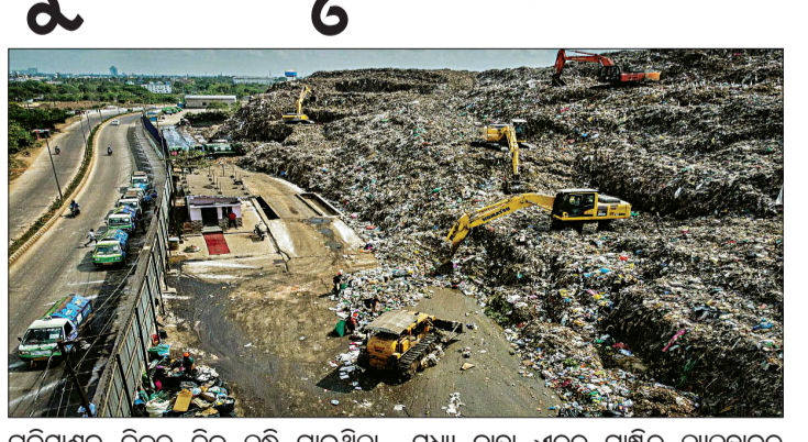
ପରିମାଣରେ ଦିନକୁ ଦିନ ବୃଦ୍ଧି ପାଉଥିବା ସଂଗ୍ରହକାରୀମାନେ ମତ ଦେଉଛନ୍ତି। ଏହାକୁ ଏବେ ବିପତନ କରିବା ସେମାନଙ୍କ ପାଇଁ ବିଚାର କାରଣ ହୋଇଛି।

ଭୁବନେଶ୍ୱର, ୧୬୫୫: ରାଜ୍ୟର ସମସ୍ତ ପୌରାଞ୍ଚଳରୁ ଯେତିକି କଠିନ ବର୍ଦ୍ଧ୍ୟ ବାହାରିଛି, ତା'ର ଏକ-ତୃତୀୟାଂଶ କେବଳ ଭୁବନେଶ୍ୱର ମହାନଗର ନିଗମ ଅଞ୍ଚଳରୁ ବାହାରିଛି। ଏହା ପଛକୁ କଟକ ମହାନଗର ନିଗମ (ସିଏମସି) ରହିଥିବା ବେଳେ ତୃତୀୟ ସ୍ଥାନରେ ସମ୍ବଲପୁର ରହିଛି।