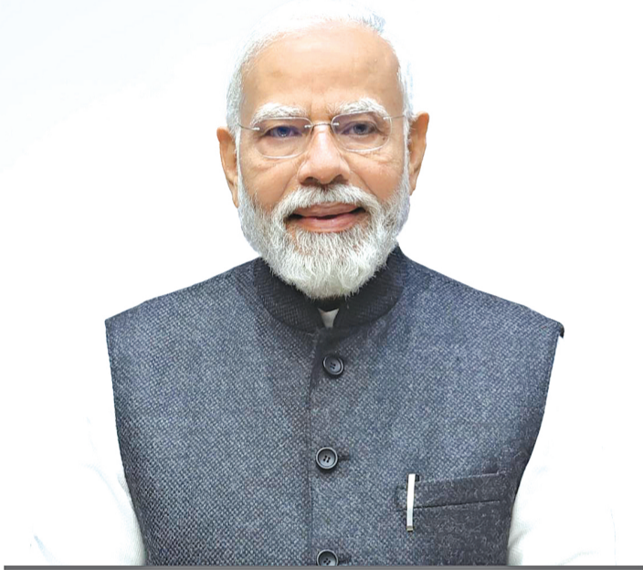
ଶ୍ରୀ ନରେନ୍ଦ୍ର ମୋଦୀ ମାନ୍ୟବର ଭାରତର ପ୍ରଧାନମନ୍ତ୍ରୀ