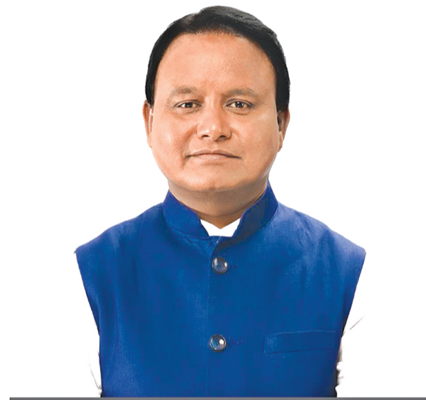
ଶ୍ରୀ ମୋହନ ଚରଣ ମାଝୀ ମାନ୍ୟବର ମୁଖ୍ୟମନ୍ତ୍ରୀ, ଓଡ଼ିଶା