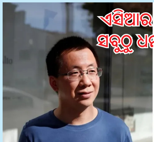
ଏସିଆର ଦ୍ୱିତୀୟ ସବୁଠୁ ଧନୀ ବ୍ୟକ୍ତି