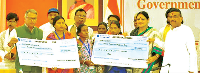
ପାଇଁ ଯାସ୍ତ ପ୍ରତିଷ୍ଠା ସଫଳ ହେବା ପରେ ଚୁକ୍ତ ସେମାନଙ୍କ ଆକାରରେ ପାଣି ଜମା କରାଯିବ। ରାଜ୍ୟ ସରକାର ଏହି ଫର୍ମ ପୂର୍ଣ୍ଣ ପ୍ରତିଷ୍ଠା ଫର୍ମ ଚଳି ମାସ ପାଇଁ ପରିଚାଳନା କରିବେ। ଫର୍ମ ପୂର୍ଣ୍ଣ

କୋଲକାତା, ୩।୬ (ସଂଚାର ବ୍ୟୁରୋ): ରାଜ୍ୟରେ ନିର୍ବାଚନ ପୂର୍ବରୁ ବିଭିନ୍ନ ଏକପକ୍ଷ ପ୍ରତିଷ୍ଠା ଦେଇଥିଲା। ରାଜ୍ୟରେ ସରକାର ପରିବର୍ତ୍ତନ ହେବା ପରେ ଏବଂ ସେହି ପ୍ରତିଷ୍ଠା ପୂର୍ଣ୍ଣ ପାଇଁ, ମୁଖ୍ୟମନ୍ତ୍ରୀ ଶ୍ରୀ ଅନୁପୂର୍ଣ୍ଣ ଯୋଜନା'କୁ ଆନୁଷ୍ଠାନିକ ଭାବରେ ଆରମ୍ଭ କରିଛନ୍ତି। ମହିଳାମାନଙ୍କ ବ୍ୟାଙ୍କ ଆକାରରେ ସୁଧାଧିକାରୀ ପାଣି ସ୍ଥାନରେ ପ୍ରତିଷ୍ଠା ଏହି ଦିନଠାରୁ ଆରମ୍ଭ ହୋଇଛି। ନବୀନରେ ଭାଷଣ ଦେଇ ମୁଖ୍ୟମନ୍ତ୍ରୀ ଯୋଗ୍ୟ କରୁଛନ୍ତି ଏହି ଅନୁପୂର୍ଣ୍ଣ ଯୋଜନା ଅଧିକାରୀ ପାଣି ଯୋଗ୍ୟ ୨୮, ୨୫, ୨୨-୫ ହିସାବରେ ଲାଭାଣ୍ଡ ଆକାରରେ ଜମା କରାଯାଇଛି। ଏହା ବ୍ୟତୀତ, ମୁଖ୍ୟମନ୍ତ୍ରୀ କହିଛନ୍ତି ଯେ ଆଗକୁ ସମସ୍ତ ଭବିଷ୍ୟତ ଆବେଦନକାରୀଙ୍କ ଅନୁପୂର୍ଣ୍ଣ ଯୋଜନା ଫର୍ମ