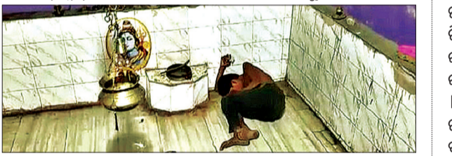
ଘଟଣାସ୍ଥଳରେ ଚୋରମାନଙ୍କୁ ହତହତା ହୋଇଛି।

କାମାକ୍ଷାନଗର, ୩।୬ (ସଂଚାର ବ୍ୟୁରୋ): ମନ୍ଦିର ଭିତରକୁ ଚୋରି କରିବାକୁ ଯାଇ ଚୋରମାନଙ୍କୁ ହତହତା ହୋଇଛି। କବାଟ ଫାଙ୍ଗରେ ପଶିଲା ଚୋର ବାହାରି ପାରିଲା ନାହିଁ। ଏହା ସହିତ, ବିମାନ ବନ୍ଦରର ଉନ୍ନତି, ଶିଳ୍ପ, ଚିରୁପତି ଏବଂ ଭୋପାଳକୁ ନୂତନ ବିମାନ ସଂଯୋଗ ଆରମ୍ଭ କରିବା ପାଇଁ ଆଲୋଚନା କରାଯାଇଥିଲା। ପ୍ରତ୍ୟେକ ୬ମାସ