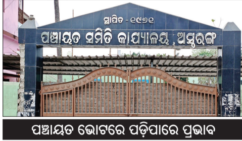
ପଞ୍ଚାୟତ ଭୋଗରେ ପଡ଼ିପାରେ ପ୍ରଭାବ

କାକରପୁର/ଅସ୍ରରଙ୍ଗ,୧୩୬ (ସଂଚାର ବ୍ୟୁରୋ): ନୂଆ ସରକାର ଉପରେ ପୁରୀ ଜିଲ୍ଲା ଅସ୍ରରଙ୍ଗ ବ୍ଲକ୍‌ବାସୀ ଯେଉଁ ଅତ୍ୟାଧିକ ଭରସା କରିଥିଲେ, ଦୁଇ ବର୍ଷ ପରେ ତାହା ନୈରାଶ୍ୟରେ ପରିଣତ ହୋଇଛି। କାରଣ ଅଞ୍ଚଳର ଦାରିଦ୍ର୍ୟ ଦିନେ ଦାରି ଆଜି ବି ଅସ୍ରୁ। ଅସ୍ରରଙ୍ଗ ବ୍ଲକ୍ ଏକ କୃଷି ଓ ମହାମୁକାଦି ବହୁଳ ଅଞ୍ଚଳ। କିନ୍ତୁ ଏଠାରେ ନା ଅଛି ଶାନ୍ତ ଭଣ୍ଡାର, ନା ଅଛି ଫିସିଂ ହାର୍ବର। ତାହା ଓ ମହାମୁକାଦି ଦୁହେଁ କ୍ଷତିଗ୍ରସ୍ତ। ଅସ୍ରରଙ୍ଗ ଗୋଷ୍ଠୀ ସ୍ୱାସ୍ଥ୍ୟ କେନ୍ଦ୍ରରେ ବର୍ଷ ବର୍ଷ ଧରି ତାକ୍ତର ପଦବୀ ଖାଲି। ଦୁର୍ଦ୍ଦଶା କିମ୍ବା ଗୁରୁତର ରୋଗୀଙ୍କୁ ‘ରେଫର୍’ ସ୍ଥିତ ଧରାଇ କଟକ-ଭୁବନେଶ୍ୱର ପାଠାଭିଆସାଧାପାଳାୟ କଲ ସଙ୍ଗତ ଏଠାରେ ଚିକିତ୍ସା। ୧୨ କୋଟିର ମେଗା ପ୍ରକଳ୍ପ କାଗଜରେ ଚାଲିଛି, କିନ୍ତୁ ଶିଶୁମ, ପୂର୍ଣ୍ଣକାରିଆ, ଆଳସ୍ୟାହି, ତଞ୍ଜାହାର, ଛୁଆଁଆଳା, ନଗର, ଝାଡ଼ୁଲିଙ୍ଗ ଆଦି ବିଭିନ୍ନ ଗ୍ରାମର ଲୋକେ ଆଜି ବି ନଳକ୍ରପର ଦୂଷିତ ପାଣି ଉପରେ ନିର୍ଭର। ଅସ୍ରରଙ୍ଗ ବଜାରରେ ଗୋଟିଏ ସୁବ୍ୟବସ୍ଥିତ ନୂତନ ବସଷ୍ଟାଣ୍ଡ ନାହିଁ। ପ୍ରତିଟି ଅଭିଯୋଗରେ ଉତ୍ତର ମିଳନ ‘ପ୍ରସ୍ତାବ ଅଛି, ଖୁବ୍‌ଶୀଘ୍ର ହେବ’। ହେଲେ ଦୁଇ ବର୍ଷ ବିତିଗଲାଣି। ଲୋକଙ୍କ ଯୌର୍ଯ୍ୟ ଭାଙ୍ଗିଗଲାଣି। ଆସନ୍ତା ଛାଣ ମାସ ପରେ ପଞ୍ଚାୟତ ନିର୍ବାଚନ। ବୃଣମୁକ ଶ୍ରବଣେ ସରକାରଙ୍କ ଛବି ଏହି ନିର୍ବାଚନରେ ପରାଜା ହେବ। ଯଦି ସରକାର ଆସନ୍ତା ୩-୪ ମାସ ମଧ୍ୟରେ ଅସ୍ରରଙ୍ଗର ଶାନ୍ତ ଭଣ୍ଡାର, ତାକ୍ତର ନିୟୁତ୍ତି, ସୁଚ୍ଛ ପାଣି ଓ ହାର୍ବର କାମରେ ଦୃଷ୍ଟାନ୍ତ ଆଗ୍ରଗତ ନ ଦେଖାନ୍ତି, ତେବେ ଭୋଟରଙ୍କ ଅପଭୋଗ୍ୟ ଦାଲାତ ବାହୁରେ ପ୍ରତିଫଳିତ ହେବା ସୁନିଶ୍ଚିତ ବୋଲି ରାଜନୈତିକ ମହଲରେ ବର୍ତ୍ତା।