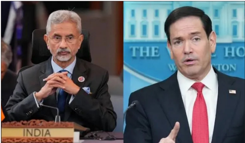
ଜଣ ଭାରତୀୟ ଥିବା ବେଳେ ୨୧ ଜଣଙ୍କୁ ଉଦ୍ଧାର କରିଥିଲେ, ତିନି ଜଣଙ୍କର ମୃତ୍ୟୁ ହୋଇଥିଲା। ସୂଚନାଯୋଗ୍ୟ ଯେ, ଜୁନ୍ ୮ ରେ ଆମେରିକା ସେନା ପାଇଲ-ପତାକାୟୁକ୍ତ ଟ୍ୟାଙ୍କରୁ ମାରିଲେଖୁ

ନୂଆଦିଲ୍ଲୀ ୧୩।୬: ହର୍ମୁଜରେ ଲଗାତାର ଭାରତୀୟ ତୈଳ ଟ୍ୟାଙ୍କର ଉପରେ ଆକ୍ରମଣକୁ ନେଇ ଭାରତ ଆମେରିକା ଓ ଭାରତ ମଧ୍ୟରେ ସମ୍ପର୍କ ତିକ୍ତ ହେବା ଆରମ୍ଭ କରିଛି। ଭାରତର ବାରମ୍ବାର ତାରିକ୍ତ ସତ୍ତ୍ୱେ ଭାରତୀୟ ଟ୍ୟାଙ୍କର ଉପରେ ଆମେରିକା ଆକ୍ରମଣ କାରି ରହିଛି। ଭାରତ ଏସମ୍ପର୍କରେ ଆମେରିକା ଦୂତାବାସକୁ ଦୁଇଥର ସମନ କରିଥିବା ବେଳେ ବୈଦେଶିକମନ୍ତ୍ରୀ ସ୍ତରରେ ଏହାର ବିରୋଧ ହୋଇଛି। ଶନିବାର ଭାରତୀୟ ବୈଦେଶିକ ମନ୍ତ୍ରୀ ଏସ୍ କର୍ମଶାଳାରେ ଆମେରିକା ବୈଦେଶିକ ମନ୍ତ୍ରୀ ମାକୋଲ୍ ଚୁକ୍ସିଙ୍କ ସହ ଫୋନ୍ ଯୋଗ କଥା ହୋଇ ଏହାକୁ ଦୃଢ଼ ବିରୋଧ କରିଛନ୍ତି। ଏଭଳି ଘଟଣା ଆଗେ ଉଚିତ ନୁହେଁ, ବାଣିଜ୍ୟିକ କାହାଳକୁ ପ୍ରତି ଏଭଳି ଆକ୍ରମଣର ଶିକାର ହେବା କଥା ନୁହେଁ ବୋଲି କର୍ମଶାଳାରେ କହିଥିବା ସୂଚନା ମିଳିଛି।