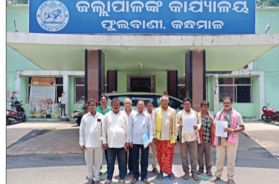
ଜିଲ୍ଲାପାଳଙ୍କ କାମ୍ପାଳୟ ପୁଲବାଣୀ, କନ୍ଧମାଳ

ପୁଲବାଣୀ,୧୩୬ (ସଂଚାର ବ୍ୟୁରୋ): କନ୍ଧମାଳ ଜିଲ୍ଲା ଫିରିଙ୍ଗିଆ ବ୍ଲକ୍ ଅଧୀନରେ ଥିବା ବାଲ୍ୟାପତ୍ତା ପ୍ରାଥମିକ ସ୍ୱାସ୍ଥ୍ୟ କେନ୍ଦ୍ରରେ ତାକ୍ତର ଙ୍ଵ ସହ ଅନ୍ୟାନ୍ୟ କର୍ମଚାରୀ ଅଭାବ ପାଇଁ ଅଂଚଳରେ ରୋଗୀସେବା ବିପର୍ଯ୍ୟସ୍ତ ହୋଇପଡ଼ିଛି। ଦୀର୍ଘ ଦିନ ଧରି ଏହି ମେଡିକାଲରେ ତାକ୍ତର ନଥିବାରୁ ମେଡିକାଲଟି କଣେ ଫାର୍ମାସିଷ୍ଟଙ୍କ ଭରସାରେ ଚାଲିଛି। ଯାହା ପାଇଁ ଅଞ୍ଚଳର ଲୋକ ମାନଙ୍କୁ ନାହିଁ ନଥିବା ଅସୁବିଧାର ସମ୍ମୁଖୀନ ହେବାକୁ ପଡୁଛି। ଏନେଇ ଶୁଭ୍ରବାର ଏହି ମେଡିକାଲରେ କଣେ ଗ୍ରାୟାଁ ତାକ୍ତର ନିୟୁକ୍ତି ଓ ଅନ୍ୟାନ୍ୟ ପଦବୀ ପୁରଣ ପାଇଁ ରାଜ୍ୟ ସ୍ୱାସ୍ଥ୍ୟମନ୍ତ୍ରୀଙ୍କ ଉଦ୍ଦେଶ୍ୟରେ ଜିଲ୍ଲାପାଳଙ୍କୁ ଦାବିପତ୍ର ପ୍ରଦାନ କରିଛନ୍ତି ଅଂଚଳର କିଛି ସ୍ଥାନୀୟ ବାସିନ୍ଦାଙ୍କ ସହ ଜନ ପ୍ରତିନିଧି।