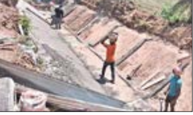
ଧର୍ମଗତରେ କେନାଲ ନିର୍ମାଣରେ ବ୍ୟାପକ ଅନିୟମିତତା ଉପସ୍ଥାପନ କରାଯାଇଛି।

କଳାହାଣ୍ଡି, ୨୫।୬(ସଂଚାର ବ୍ୟୁରୋ): କଳାହାଣ୍ଡି ଜିଲ୍ଲା ଧର୍ମଗତ ରକ୍ତ ଉତ୍ସାର ଉପକ୍ରମରେ ଉପସ୍ଥାପନ କରାଯାଇଛି।