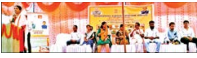
ରାଜ୍ୟ ସରକାରଙ୍କ ଦ୍ୱାରା ପୂର୍ଣ୍ଣ ଅବସରରେ 'ବିକାଶର ଧାରା ଓଡ଼ିଶା ସାରା' କାର୍ଯ୍ୟକ୍ରମ ଅନ୍ତର୍ଗତ ମାସିକ ସାଧାରଣ ବୈଠକ ଅନୁଷ୍ଠିତ ହୋଇଛି।

କନ୍ଧମାଳ, ୨୬।୬(ସଂଚାର ବ୍ୟୁରୋ): ରାଜ୍ୟ ସରକାରଙ୍କ ଦ୍ୱାରା ପୂର୍ଣ୍ଣ ଅବସରରେ 'ବିକାଶର ଧାରା ଓଡ଼ିଶା ସାରା' କାର୍ଯ୍ୟକ୍ରମ ଅନ୍ତର୍ଗତ ମାସିକ ସାଧାରଣ ବୈଠକ ଅନୁଷ୍ଠିତ ହୋଇଛି।