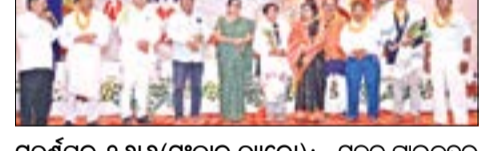
ସୁବର୍ଣ୍ଣପୁର, ୨୬।୬(ସଂଚାର ବ୍ୟୁରୋ): ସର୍ବରାଜ୍ୟ ସ୍ତରୀୟ ନିବେଦିତା ରଥଙ୍କୁ ନାଗରିକ ସମ୍ମାନ ଦିଆଯାଇଛି।