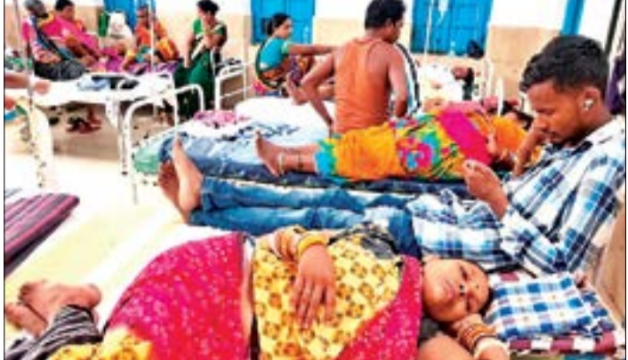
ସ୍ୱାସ୍ଥ୍ୟ ବିଭାଗର କେନ୍ଦ୍ରୀୟ ପ୍ରତିନିଧି ଦଳ ଧର୍ମଗତ ରକ୍ତ ଉତ୍ସାର ଉପକ୍ରମରେ ଉପସ୍ଥାପନ କରାଯାଇଛି ।

ଅନୁଯାୟୀ, ଭିତ୍ତିଭୂମିର ଅଭାବ ଦର୍ଶାଇ ଗତ ୧୫ ଦିନରୁ ଅଧିକ ହେଲାଣି ରକ୍ତ ଉତ୍ସାରକୁ ସମ୍ପୂର୍ଣ୍ଣ ବନ୍ଦ କରିଦିଆଯାଇଛି । ଗତ କିଛି ଦିନ ତଳେ ରକ୍ତ ଉତ୍ସାର କ୍ରମେ ବନ୍ଦ କରିଦିଆଯାଇଛି । ଗତ କିଛି ଦିନ ତଳେ ରକ୍ତ ଉତ୍ସାର କ୍ରମେ ବନ୍ଦ କରିଦିଆଯାଇଛି ।