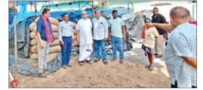
ଖୋଲା ଆକାଶ ତଳେ ପଡ଼ିଛି ଶହ ଶହ ବସ୍ତା ଧାନ। ପୂର୍ବତନ ଆଇନମନ୍ତ୍ରୀ ନରସିଂହ ମିଶ୍ର ଶହ ଶହ ବସ୍ତା ଧାନ ପ୍ରତିଦାନ କରିବାକୁ ଆଇନମନ୍ତ୍ରୀ ନରସିଂହ ଖୋଲା ଆକାଶ ତଳେ ପଡ଼ିଛି ଶହ ଶହ ବସ୍ତା ଧାନ।

ବଲାଙ୍ଗିର, ୨୬।୬(ସଂଚାର ବ୍ୟୁରୋ): ପୂର୍ବତନ ଆଇନମନ୍ତ୍ରୀ ନରସିଂହ ମିଶ୍ର ଶହ ଶହ ବସ୍ତା ଧାନ ପ୍ରତିଦାନ କରିବାକୁ ଆଇନମନ୍ତ୍ରୀ ନରସିଂହ ଖୋଲା ଆକାଶ ତଳେ ପଡ଼ିଛି ଶହ ଶହ ବସ୍ତା ଧାନ।