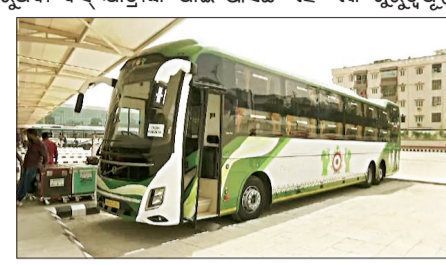
ଏସି ସ୍ଥିପର ବସ୍ ଉଡ଼ା ସ୍ଥିର କଲେ ସରକାର। ଏହା ପାଇଁ ଆସିଛି ଏକ ଗୁରୁତ୍ୱପୂର୍ଣ୍ଣ ଖବର।

ଭୁବନେଶ୍ୱର, ୧୦୧୭ (ସଂଚାର ବ୍ୟୁରୋ): ଏସି ସ୍ଥିପର ବସ୍ ଯାତ୍ରାଙ୍କ ପାଇଁ ଆସିଛି ଏକ ଗୁରୁତ୍ୱପୂର୍ଣ୍ଣ ଖବର। ସୁପର ପ୍ରିମିୟମ ସ୍ଥିପର ଏସି ବସ୍ ଉଡ଼ା ସ୍ଥିର କଲେ ସରକାର। ଏଣିକି ଏସି ବସ୍ ଯାତ୍ରାକୁ ନିଲୋମିତର ପିଛା ଦେବାକୁ ପଡ଼ିବ ୩.୫୦ ପଇସା। ଓଡ଼ିଶାରେ ଲମ୍ବା ଦୂରତାକୁ ଯାତ୍ରା କରୁଥିବା ବସ୍ ଯାତ୍ରାଙ୍କ ପାଇଁ ଆସିଛି ଏହି ଏକ ଗୁରୁତ୍ୱପୂର୍ଣ୍ଣ ଖବର।