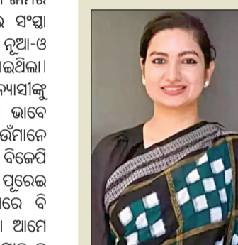
ବୋଲି ସାବ୍ୟସ୍ତ କରିଛନ୍ତି। କଟକ ରାଜନୀତିରେ ଯୋଡ଼ିଆଙ୍କ ଏଭଳି ଶାଣିତ ସୂଚନା କାମିଆପରକୁ ବହୁ ଆଗକୁ ନେଇଥିବା ବୋଲି ରାଜନୀତି ମହଲରେ ଚର୍ଚ୍ଚା କୋର ଧରିଛି।

ଐତିହାସିକ ବାଲିଯାତ୍ରାର ଅଦ୍ୟତ୍ତକୁ ନେଇ ଯୋଡ଼ିଆଙ୍କ ଦୁଇ ପଦ କଥା ଏବେ ରାଜନୀତିରେ କମ୍ପନ ସୃଷ୍ଟି କରିଛି। କଟକର ବଡ଼ ବଡ଼ ନଗରୀ ଯାହା କହିବାକୁ ଶହେ ଥର ଭାବିଆଛି ଯୋଡ଼ିଆ ଗୋଟିଏ ନିଶ୍ଚାସରେ ତାହା କହିଛନ୍ତି। ବାଲିଯାତ୍ରାରେ ସବୁ ଦିଗ୍ଘାଟର ମୂଳ ସାକ୍ଷିକ କଟକ ଜିଲ୍ଲାପାଳଙ୍କୁ ଲକ୍ଷ୍ୟକରି ଯୋଡ଼ିଆ କହିଛନ୍ତି, କାମ ନକରିପାରିଲେ କଟକ ଛାଡ଼। ଅଧିକାରୀଙ୍କୁ ଏଭଳି କଥା କଥା କହି ଯୋଡ଼ିଆ ରାଜନୀତିରେ ନିଜର ଉଦ୍‌ବେଗ ଦେଖାଇବା ସହିତ ନିଜକୁ ଜଣେ ପକ୍ଷୀ କଟକିଆ ବୋଲି ସାବ୍ୟସ୍ତ କରିଛନ୍ତି। କଟକ ରାଜନୀତିରେ ଯୋଡ଼ିଆଙ୍କ ଏଭଳି ଶାଣିତ ସୂଚନା କାମିଆପରକୁ ବହୁ ଆଗକୁ ନେଇଥିବା ବୋଲି ରାଜନୀତି ମହଲରେ ଚର୍ଚ୍ଚା କୋର ଧରିଛି।