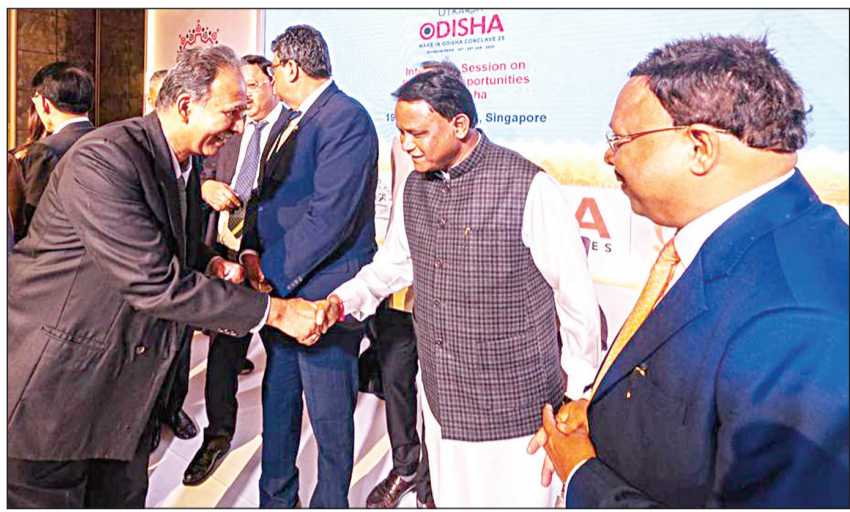
ସିଙ୍ଗାପୁରରେ ପ୍ରବାସୀ ଭାରତୀୟଙ୍କ ସହ ମୁଖ୍ୟମନ୍ତ୍ରୀ ମୋହନ ଚରଣ ମାଝୀ

ଭୁବନେଶ୍ୱର ରୁପ୍ୟାଣ ୨୦ ନଭେମ୍ବର ୨୦୨୪ | ପୃଷ୍ଠା, ମୂଲ୍ୟ ୪ ଟଙ୍କା