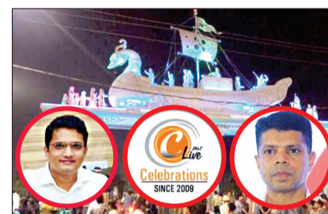
ଲାପଟପରେ ଚର୍ଚ୍ଚା କରି ଏକ-ଓ ସଂସ୍ଥାକୁ ଚେଷ୍ଟର ଦେଲେ। ଏହା ପ୍ରମାଣିତ କରୁଛି କେଉଁଠି ନା କେଉଁଠି ଏବେ ବି ସରକାରୀ କାର୍ଯ୍ୟରେ ସନ୍ୟାସୀ ପଦରା ପଛରୁ ପ୍ରଭାବିତ କରୁଛନ୍ତି ଆଉ ମୁଖ୍ୟମନ୍ତ୍ରୀ ମୋହନ ମାଝୀଙ୍କୁ ୧୫ ପୃଷ୍ଠା-୬