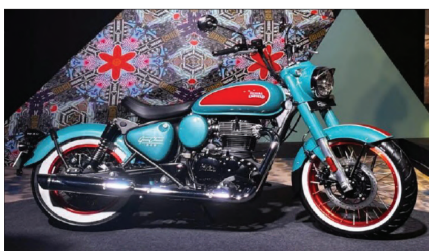
ମ୍ୟାଟ୍ ଫିନିଶ୍ ଟ୍ୟୁକ୍ କଲର ଅଧିକ ଅଛି। ଏହାର ୩୫୦ ସିସି ଇଞ୍ଜିନ୍ ୨୦ ବିଏସପି ପାୱାର ଏବଂ ୨୭ ନ୍ୟୁଟନ୍ ମିଟରର ପିକ୍ ଟର୍କ୍ କେଜେନେଟର କରିବ।

ଏକ 'ବରଷ୍ଟା ସ୍ଟାଇଲ୍' ବାଇକ୍ ହେବ। ରୟାଲ୍ ଇନ୍ଫିଲ୍ଡ ଗୋଆନା କ୍ଲ୍ୟୁସିକ୍ ୩୫୦ ସମ୍ପୂର୍ଣ୍ଣରୁ ଏପର୍ଯ୍ୟନ୍ତ ପ୍ରକାଶ ପାଇଥିବା ସୂଚନା ଅନୁଯାୟୀ,